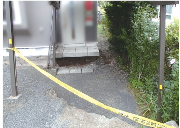
건물 주변의 지반 침하(홋카이도이부리동부지진)