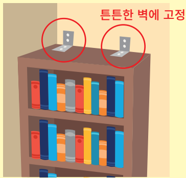
책장 등을 튼튼한 벽이나 천장에 고정