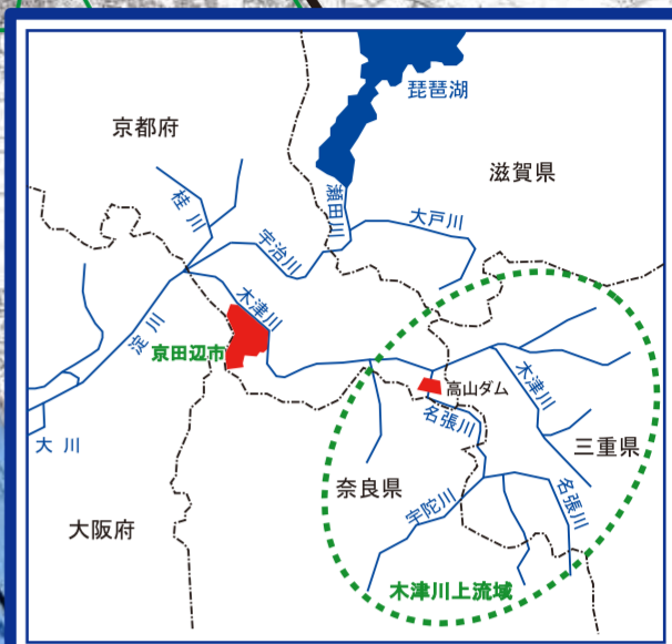
木津川と京田辺市の位置