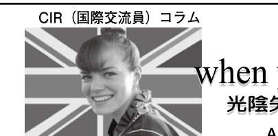
CIR (国際交流員) コラム

11月8日(日)13時30分～16時30分、府山城広域振興局(宇治市) ⑥後縦帯骨化症・脊柱管狭窄症の患者と家族(▼講演(テーマ：脊柱の病変(後縦帯骨化症・脊柱管狭窄症)とその治療。講師：医療法人社団医聖会学研都市病院院長の四方實彦医師)▼患者家族交流会(先着30人(500円(昼食費一部負担) ⑥必要