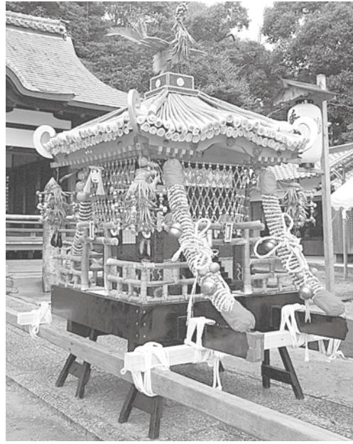
完成した瑞饋神輿

平成21年10月1日現在 世帯数 24,473世帯 男 30,732人 女 32,233人 合計 62,965人