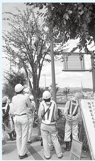
講師から剪定するポイントを教わる参加者