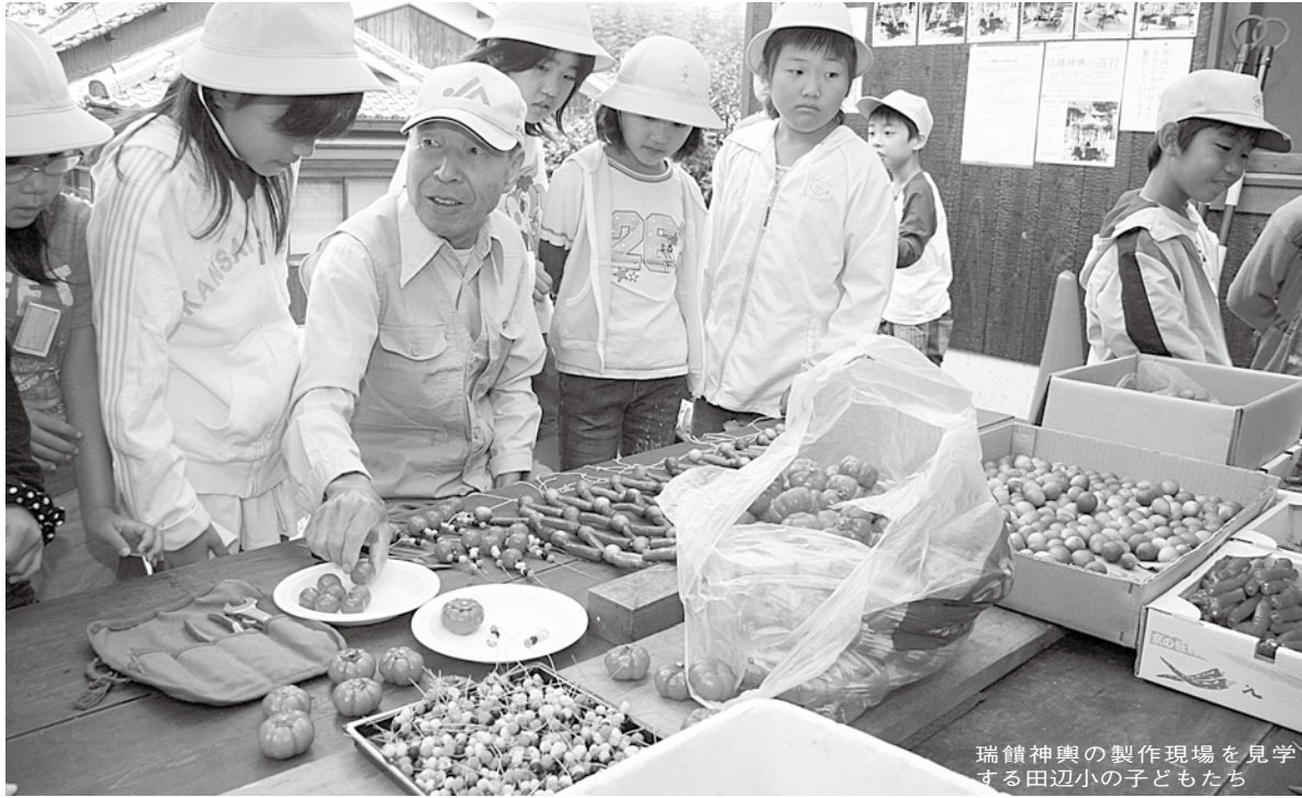
瑞饋神輿の製作現場を見学する田辺小の子どもたち