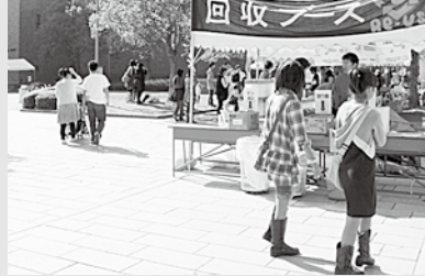
模擬店でリユース食器を使用しているエコなお祭りです

また、同祭では、「日本一エコなお祭り」をモットーに、模擬店でリユース食器を使用。使用済み天ぷら油を使って発電し、同祭で使用する電気として利用します。これにより、祭から排出するごみを最小限に抑えます。