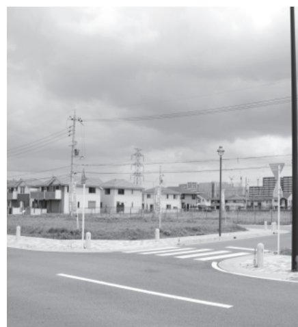
住宅地開発が進む松井山手西地域

②大手幹線開通に伴う 諸問題について。 の大住地域における渋 滞と住宅地への交通量の 増加による危険回避の対 策は。大住ヶ丘、松井ヶ