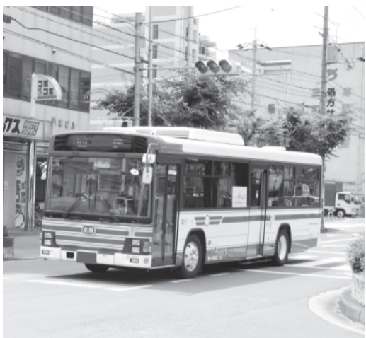
市内を運行する民間の路線バス

を。長年の市民の要望で あり、早期に運行計画を 作るべき。特に市役所周 辺への利便性を要望する 年内をめどに結論を出し