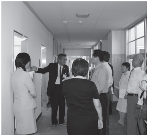
トイレの増改築後の説明を受ける委員 (田辺小学校)

新たな税徴収の方策を進めると共に、歳入の確保に向けた積極的な取り組みを求める。権限移譲や定年退職者も増えることから、今後は仕事量の増大と専門性が求められる。この際、定数管理の見直しを行い、新規採用の拡大など、人材の確保に努めるべき。保育所の