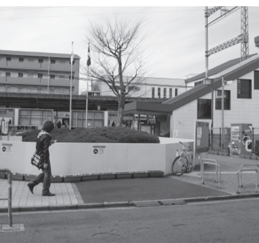
近鉄新田辺駅東口付近の風景(河原食田)

また、定数管理削減と交通状況はひどくなる一方で、大変危険である。一日も早く駅前整備をすすめるべきでは。