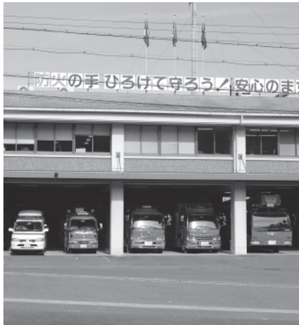
31名の職員が不適切なサイトを見ていたとされる市消防本部

①病院の空き病室などを調べる目的で府が消防指令室に貸与したパソコンで、勤務時間にわいせ