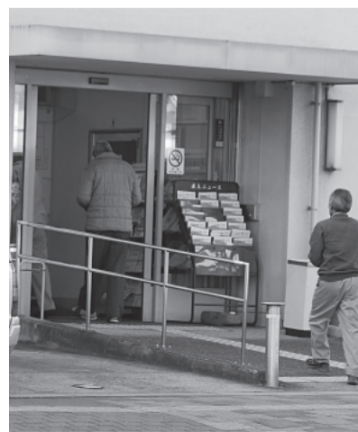
ハローワーク京都田辺を訪れる求職者(田辺中央二丁目)