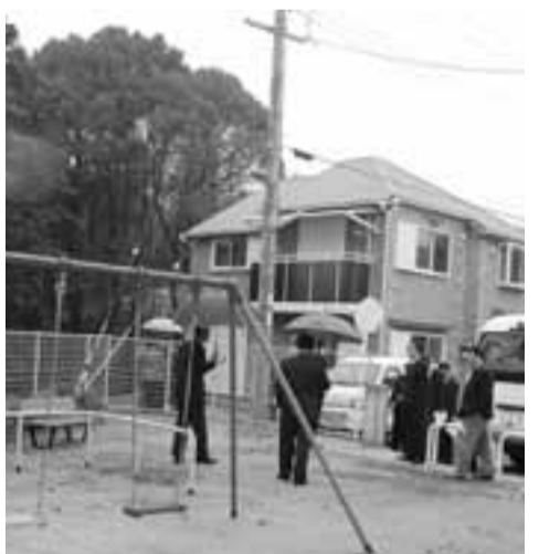
新里ノ内公園を視察する委員

準備状況は、また評価の対象 目的は、職員課長 1月に説明会を行い、課長が課長を部長が課長を、副市長が部長を評価し全体を統括。今後、課員による評価等を検討したい。