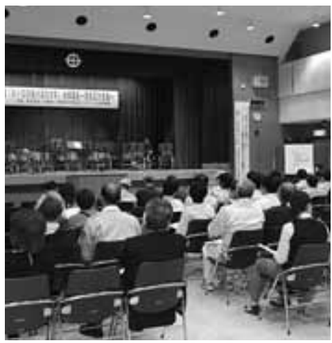
男女共同参画研修会の様子