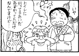
京田辺市明るい選挙推進協議会