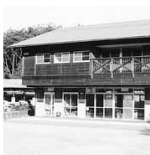
情報教育推進の拠点であった野外活動センター研修棟