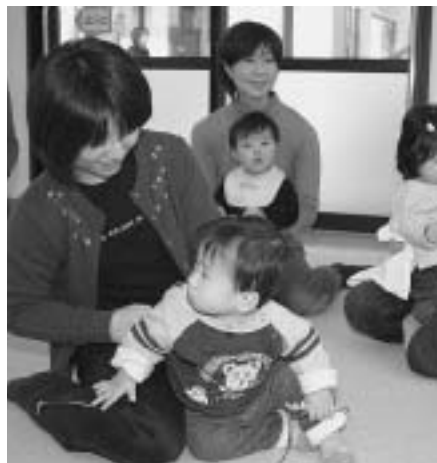
地域子育て支援センター (大住保育園)

大住児童館と宝生苑の世代間交流等の福祉部長 施設自体は別々の運営だが、交流の部分は、利用者会議の中で意見等を聞きたい。 ファミリーサポート事業が開始されたが、市の受け止め方は、児童福祉課長 2月末で83人の登録があり、評判がよく、喜ばれていると認識している。 特別養護老人ホーム入所希望に必要な方を把握しているのか。高齢介護課長 各施設の方で、状況は把握している。 大住児童館と宝生苑の世代間交流等の福祉部長 施設自体は別々の運営だが、交流の部分は、利用者会議の中で意見等を聞きたい。 ファミリーサポート事業が開始されたが、市の受け止め方は、児童福祉課長 2月末で83人の登録があり、評判がよく、喜ばれていると認識している。 特別養護老人ホーム入所希望に必要な方を把握しているのか。高齢介護課長 各施設の方で、状況は把握している。 児童虐待防止ネットワーク構築に向けての予算内容は、児童福祉課長 相談窓口が市にも設置されるようになり、虐待防止の研修会、パンフ作成、委員報酬などが含まれる。 生活保護世帯数とその高齢化率は、社会福祉課長 12月1日現在で、421世帯で、高齢化率は、23.1%。 住民基本台帳の閲覧に際し、マイナンバー等は作成しているのか。市民課長 取扱要項の中で規定をし、審査のうち、閲覧の可否を決める。 所得税の年金課税の影響で、福祉部での低所得者に対する減免規定の変更を、福祉部長 従来通りで変更しない。 国保税の引き下げは考えられないか。助役 基金を取り崩さないで国保の予算が組めないで、考えはない。 のスケジュールは、河原保育所の改築 児童福祉課長 17年度