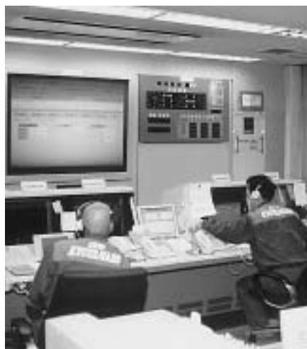
救急の拠点である「消防本部通信司令室」