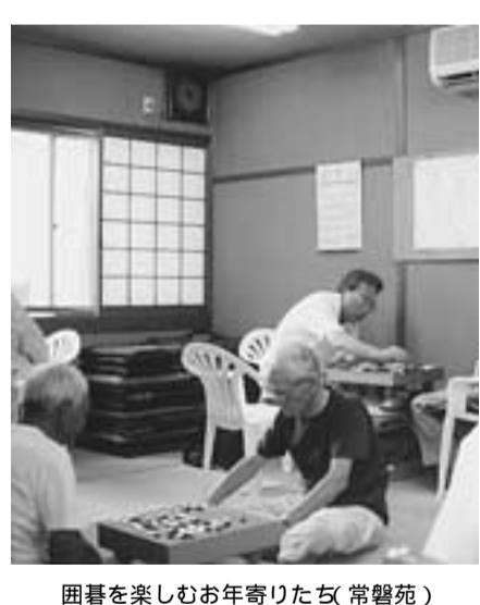
囲碁を楽しむお年寄りたち(常盤苑)

③ リサイクルプラザの進捗状況は。経済環境部長 現在、機器選定等の最終調整を行っている。運営計画については、リサイクルプラザの運営は、現在の市職員体制で行う。リサイクル処理ラインやプラザ棟の受付業務は、高齢者等を視野に入れた一部外部委託を検討している。運営計画の策定に当た