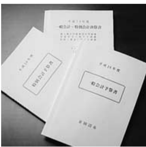
本市の予算書・決算書

間、16トンの工場棟と循環型社会情報展示室、リサイクル工房、学習・研修等を備えたプラザ棟を主要施設として、資源ゴミ、リサイクル品等を保管するストックヤードも併せて建設する計画である。また、プラザの特徴は、新たな処理ライン等を設けたことである。