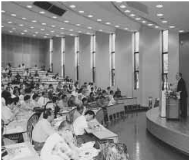
講義を聴く京たなべ・同志社ヒューマンカレッ ジの受講生(同志社大学京田辺キャンパス)

京たなべ男女共同参画週 合っていきましよう！ 間実行委員会は「今、いきをテーマに「ふれあい いきしていますか？共に支え合っていきましょう」 を閉じます。