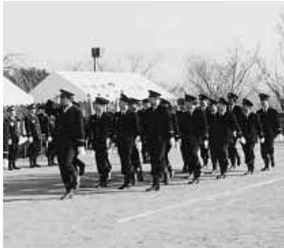
平成14年出初式で行列行進をする消防団員のみなさん(田辺公園多目的運動広場)

第2京阪道路は、久御山町と門真市を結ぶ全長約28kmの有料道路。来春には久御山町から枚方市の国道307号交差点までが開通予定で、現在、建設工事のピークを迎えています。