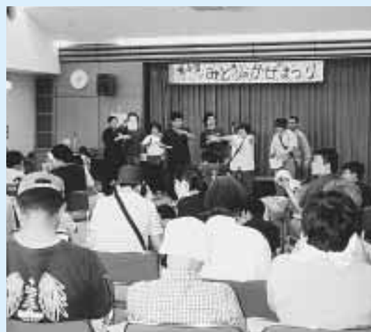
社会福祉センターで開かれた緑の風まつり

緑の風まつり「このま ちで働き、このまちで暮 らす」(主催)同実行委 員会・たなべ緑の風作業 所)が5月25日に社会福 祉センターで開きまし た。 会場では、ボランティア などによる模擬店やス テージ発表、利用者が 作った陶芸作品や手すき はがき・こみ袋などの展 示や販売も行われ、来場 者約400人は利用者との 交流を楽しみました。 このイベントを主催し た知的障害者通所授産施 設、たなべ緑の風作業所 は、現在40人を超える利 用者が通所。軽作業や生 活訓練などを行っていま す。 作業所が利用者の増加 によって手狭になったこ とから、第2作業所の建 設なども計画されてお り、それらを市民のみな さんに理解していただき うと行われたものです。