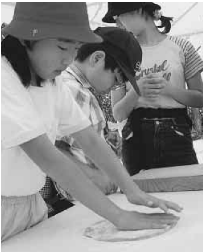
玉露入りのそばを作る子どもたち(飯岡地域)

玉露入りのそば打ちを体験 飯岡玉露そばクラブ(出 島重雄会長、60人)は、5 月25日に市内の子もたち を対象に「そば打ち体験と 試食会」を行いました。 手打ち体験をしたのは、 市青少年を守る会の150 人。8班に分かれ、同クラ ブのメンバーに指導を受け ながら、お茶の香りがする 「おいしい」と舌鼓を打っ ていました。