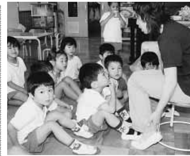
先生の話しを聞く草内幼稚園児

市は保護者の経済的負担を行っています。を軽減するため、公立幼稚園は私立幼稚園の保育料の減免(還付)就園奨励事業により、各私