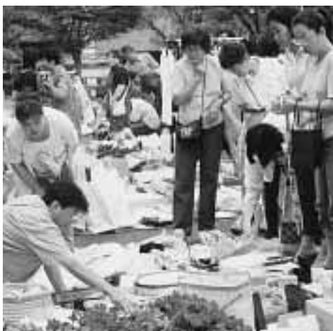
多くの参加者が訪れた昨年のフリーマ ーケット(中央公民館)

同カレッジは、市民の生 涯学習を支援し心豊かな自 己と生き生きとした文化的な 地域づくりをめざそうと平 成5年にスタートし、今年 で10年目。登録者は年々増 加し、今年市内をはじめ 近隣府県から過去最多の4 40人の応募がありました。