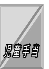
振り込みの確認を

児童手当を現在受給されている方へ(公務員を除きます)は、6月期分(2～5月分)が6月10日(月)～14日(金)に振り込まれます。ご確認ください。 くわしくは、児童福祉課(64-1377)へお問い合わせください。