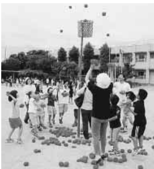
地域対抗で行われた三山木地域スポーツ大会の玉入れ(三山木小学校)

市社会体育協会と教育委員会は、市民相互の親睦を大縄跳びや玉入れ・ベタンす梅雨空の下、心地よい汗を流すなど4種目が行われ、参を流していました。草内・桃園小など 全国ハンド大会へ 市小学生ハンドボール大会は、加者は、時おり日差しがさす中、市内で行われる全国大会への出場をかけた、6月23日に一斉に開きました。三山木小学校で開かれた