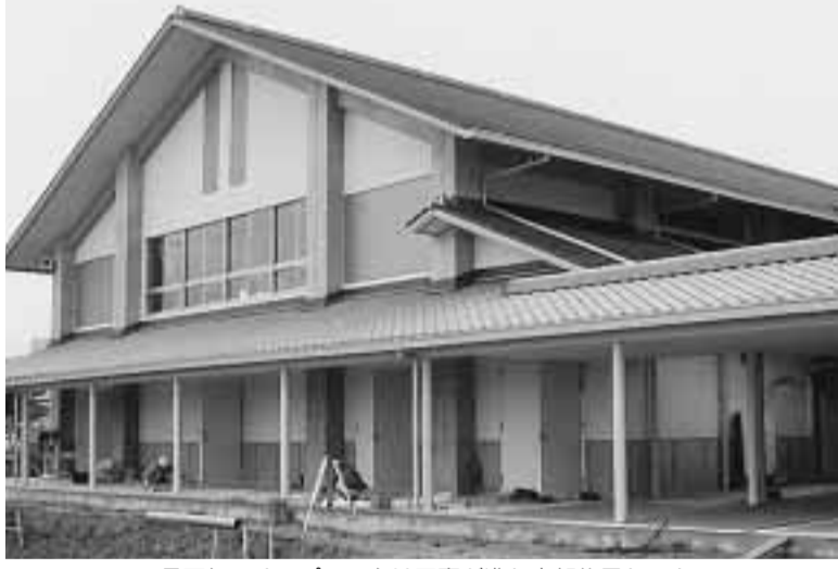
10月下旬のオープンに向け工事が進む中部住民センター

市は、大規模な災害発生(下表)を定めています。時に長時間にわたって安全確保ができ、多くの避難場所と避難所がどこにあるの収容ができる広域避難場所か、覚えておきましょう。を14箇所と避難所5箇所