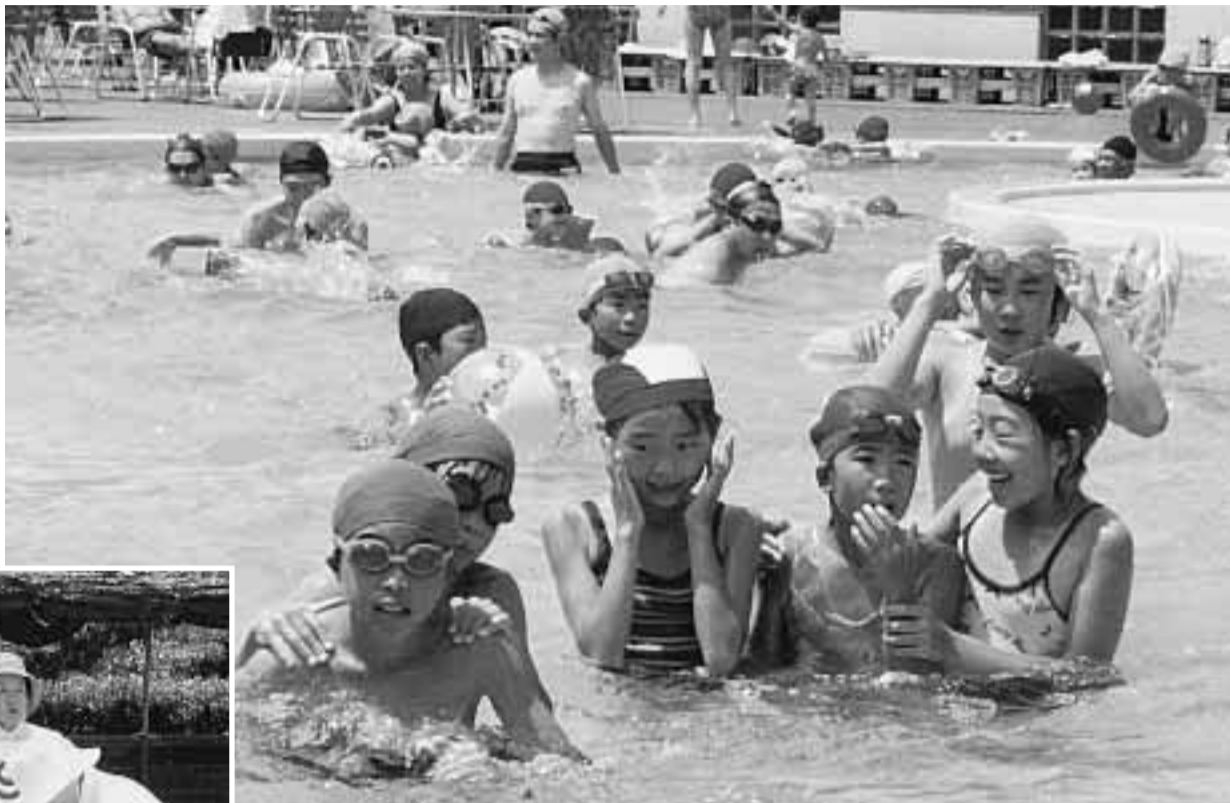
多くの市民でにぎわう田辺公園プール