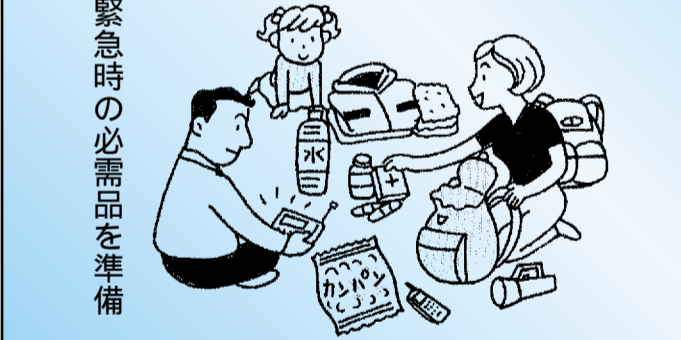
緊急時の必需品を準備

出た時は、速やかに指定された場所へ避難しましょう。特に乳幼児・高齢者などは避難に時間がかかります。危険を感じたら、隣近所で助け合いながら早急に避難しましょう