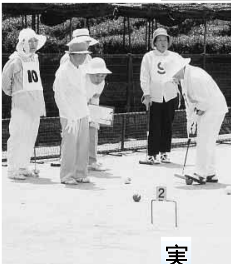
市老連ゲートボール大会で市代表を目指してボールを打つ参加者(老人福祉センター常磐苑)