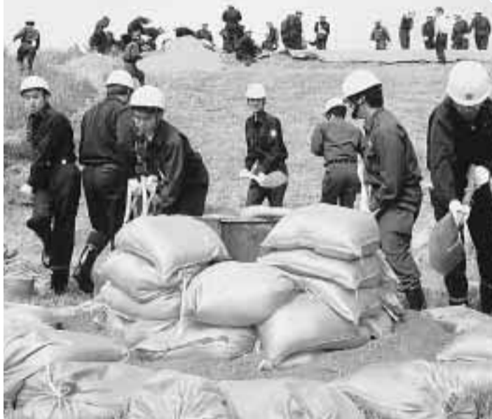
台風や集中豪雨時の河川はんらんによる水害。5月26日に行われた水防訓練に参加する消防団員のみなさん(木津川玉水橋下流の河川敷)

これからの季節は、台風や集中豪雨が発生しやすく、毎年、各地で大雨による洪水や土砂災害・暴風雨による被害が出ています。災害は突然発生し、大きな被害をもたらします。日ごろから、家の周りや地域の危険箇所を確認し、家族や地域で安全対策を話し合っておきましょう。