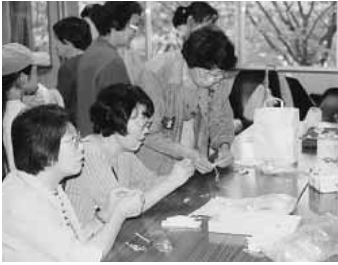
小物づくりに挑戦する参加者(中央公民館)

ふれあい夢フェスタ 共同参画社会へ理解を深める 「ふれあい夢フェスタ」共同参画週間実行委員会(主催)京たなべ男女が6月29日、中央公民館で