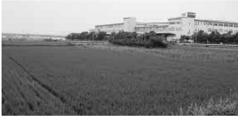
既存の大住工業専用地域を拡大して工場敷地を造成し、立地希望企業を募る拡大予定地