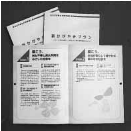
新かがやきプランのダイジェスト版

具体的施策を明らかに 市は、市民意識調査結果にかかわらず、あらゆる男女共同参画推進懇話会などの意見を踏まえ、5つなどの基本目標と17の重点課題を基本目標と17の重点課題からなる「京田辺市男女共同参画計画」を策定しました。 このプランは、21世紀の新たな時代を一人ひとりの人権が尊重され、男女が家庭・地域・学校・職場などあらゆる場でも協力し責任を担うとともに、性別 また、このプランは平成11年に国の法律として制定された「男女共同参画社会基本法」に基づいた京田辺市独自の計画です。男女共同参画社会の実現を目指す