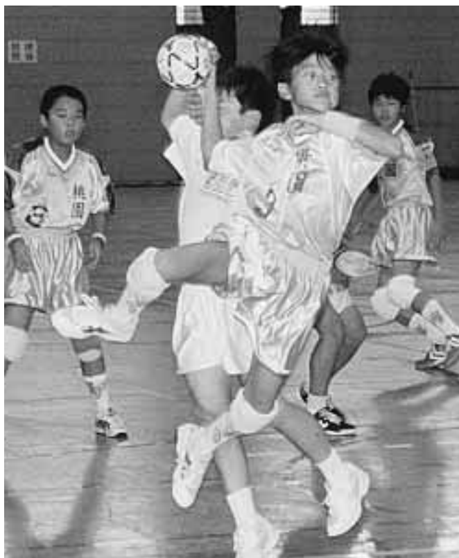
毎年白熱した試合が行われる全国小学生ハンドボール大会

【財】日本ハンドボール協会 喜びを経験する機会を提供は「第15回全国小学生ハンドボール大会」を8月2日(金)から4日(日)まで田辺中央体育館や同志社大学京田辺キャンパス体育館などで開きます。 この大会は、全国の少年少女にハンドボール競技の 全国から千人を超える選手たちが本市に集まり、大会成功のため、市民(田辺中央体育館内、62・1501)の温かいご声援、ご協力 上位入賞をめざして 8月2日から開かれる全国小学生ハンドボール大会に、本市から京都府代表として男子は草内小学校と女子は桃園小学校チーム、大会開催地代表として市男女選抜チームが出場します。 いずれのチームとも全国大会での上位入賞が期待されています。 本市から出場するチームの試合時間と場所(予選リーグ)は次のとおりです。 男子の部 【草内小学校ハンドボールチーム】 2日(金)午前11時25分～午後0時5分・田辺中央体育館 2日(金)午後3時5分～午後4時5分・田辺中央体育館 3日(土)午前10時5分～午後0時5分・田辺中央体育館 3日(土)午後3時5分～午後4時5分・田辺中央体育館 女子の部 【桃園小学校ハンドボールチーム】 2日(金)午前11時55分～午後0時35分・田辺高等学校体育館 2日(金)午後3時35分～4時15分・田辺高等学校体育館 3日(土)午前10時25分～11時5分・田辺高等学校体育館 3日(土)午後0時50分～1時30分・田辺高等学校体育館 3日(金)午前11時20分～正午・田辺高等学校体育館 決勝トーナメントの日程 【市選抜チーム】 2日(金)午後0時50分～1時30分・田辺高等学校体育館 2日(金)午後3時50分～4時30分・田辺高等学校体育館 3日(土)午前10時5分～11時5分・田辺高等学校体育館