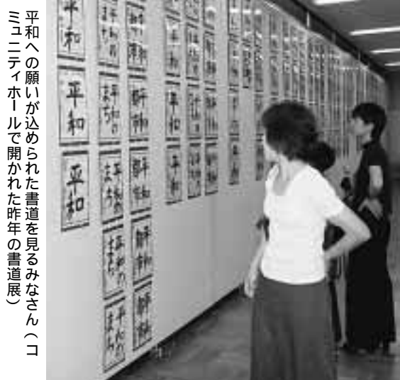
平和への願いが込められた書道を見るみなさん(コミュニティホールで開かれた昨年の書道展)

「花いちもんめ」上演 問合せ先＝市平和都市推進協議会(総務課内、64・1326) 日時＝8月6日(火)～9日(金) 時間＝午前10時～午後6時(ただし、土・日曜日は午後5時までです) 場所＝中央図書館 北住民センター 内容＝「学童疎開」戦時下の子どもたちをテーマにした図書の展示 問合せ先＝中央図書館 北住民センター(63・7955)