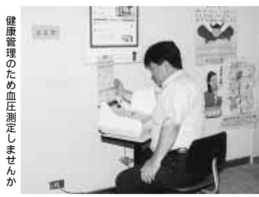
健康維持のための血圧測定しませう

市役所に最新型血圧計 市は、市役所2階西側出入口付近に最新型血圧計を設置しています。この血圧計は音声ガイド付きの最新型で、測定が簡単で、市役所へも簡単に測定できます。市役所へも簡単に測定できます。市役所へも簡単に測定できます。