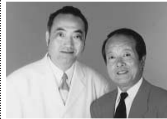
「はな寛太・いま寛大」さん

日時＝10月15日(土)午前9時30分から 対象＝昭和10年以前に生まれた市民 場所＝田辺中央体育館 希望者はバスで送迎します。