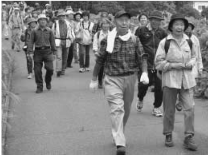
自然を楽しみながら名所や旧跡を巡り歩いてみませんか(昨年の一休さんウォーク)

一休さんウォーク実行委員会は、本市の豊かな自然の中で名所や旧跡を巡り歩く「一休さんウォーク2005」を開きます。 あなたも健康や体力づくりのために参加してみませんか。 開催日：11月12日(土) 受付時間：午前8時30分～9時30分 オープニング：午前9時30分 スタート・ゴール：田辺公園多目的運動広場 コース① 初心者コース(約6km)・・・スタート：一休寺・京奈和自動車道側道、酒屋神社・ゴール：一休寺(約12km)・・・スタート：一休寺・京奈和自動車道側道、酒屋神社・ゴール：観音寺(約17km)・・・スタート：脚コース(約17km)・・・スタート：一休寺・甘南備山・京奈和自動車道側道、酒屋神社・ゴール：観音寺・酒屋神社