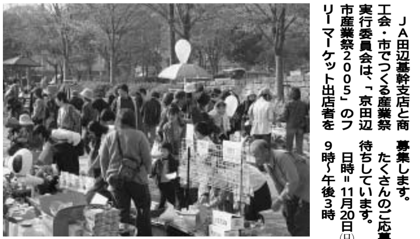
あなたも出店しませんか(昨年の産業祭でのフリーマーケットの様子)

介護保険 居住費・食費が自己負担に 10月から施設利用者対象 低所得者には軽減も これまで介護保険施設を利用している人は、居住費と食費の一部が介護保険から給付されていましたが、在宅の人は自己負担となっていました。そこで、両者の公平性を図るために、10月から施設利用者からサービスを受ける時の居住費と食費が利用者の自己負担となります。 ただし、所得の低い人には負担が重くならないように、所得の低い人は、所得に応じて負担が軽減されます。軽減を受けるためには申請が必要ですが、忘れずに申請してください。 【申請できる対象者】利用者負担第1段階：住民税非課税世帯で年齢福祉年金を受けている人または、生活保護を受けている人 同第2段階：住民税非課税世帯で合計所得金額が80万円以下の人 同第3段階：住民税非課税世帯で利用者負担第2段階に該当しない人 または、住民税課税者がいる高齢者世帯で、特別減額措置を受けている人 【対象となるサービス】要介護認定者：介護老人福祉施設・介護老人保健施設・介護療養型医療施設・短期入所生活介護・短期入所療養介護・介護療養型医療施設・短期入所生活介護・短期入所療養介護 要支援認定者：短期入所生活介護・短期入所療養介護・通所介護や通所リハビリテーションの食費は対象となりません。