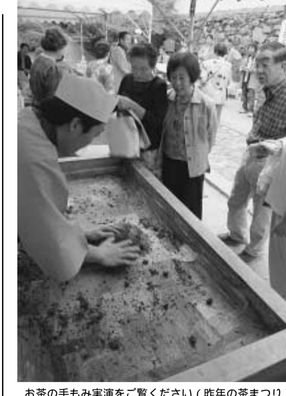
お茶の手もみ実演をご覧ください(昨年の茶まつり)