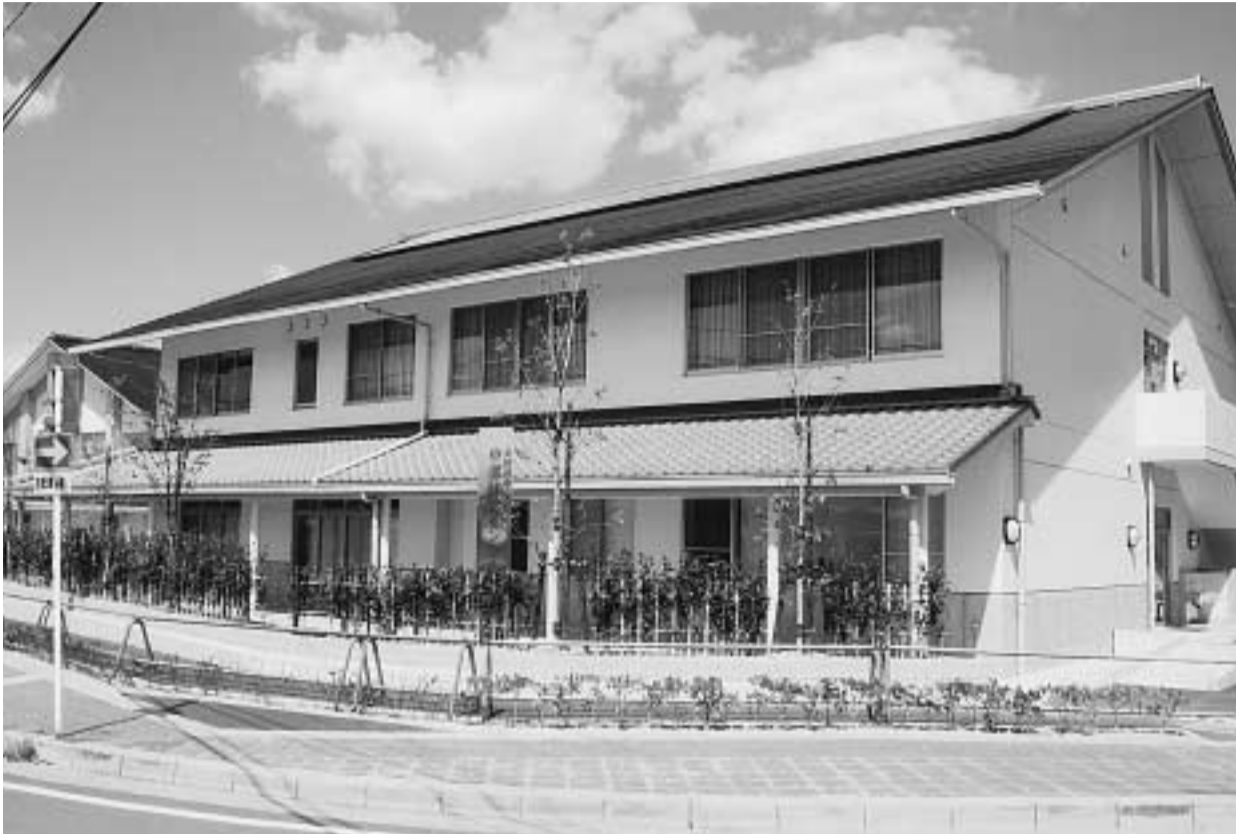
環境衛生センター緑泉園の南側に建設された中部住民センター