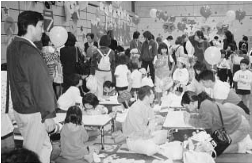
田辺中央体育館で行われた昨年の保育のつどい

保育のつどい実行委員会は「ふれあい、笑顔、みんな仲よし」をテーマに保育のつどいを開きます。 このつどいは、「未来に向けて、希望あふれる子どもたちの幸せを願い、子ども同士ふれあいや遊びを楽しむ事」を目的に行われるものです。 日時 10月26日(土)午前9時30分～正午(雨天決行) 場所 田辺中央体育館とその周辺 内容 田辺中央体育館：赤ちゃんコーナー・キールホルダーづくり・ミニミニバスケット・手作り楽器で遊ぶ・和太鼓 同館周辺：フレンドリーコンサート・輪投げ・移動劇場・わんぱくランド・交通安全コーナー・ミニ消防コーナー・おたのしみカプセル