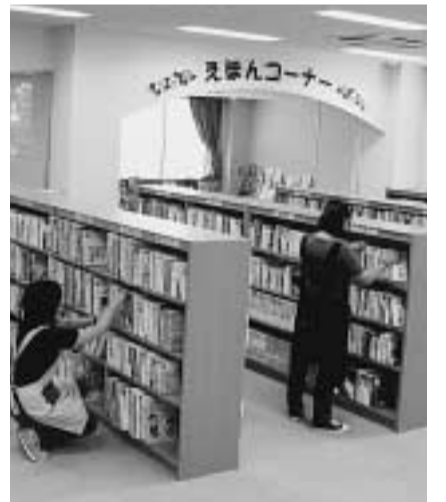
オープンにむけて準備が進む中央図書館中部分室