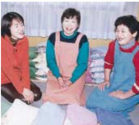
レポーター(左)に竹炭を使った枕の話をするメンバー

市は、1月1日午前10時15分から30分までの15分間、KBS京都テレビ(UHF34ch)で「京田辺市新春特別番組」を放送します。 番組は手話通訳の入った見やすくわかりやすいもの。おせちを食べながら、ほっと一息つけるひとときに、変わりゆくふ