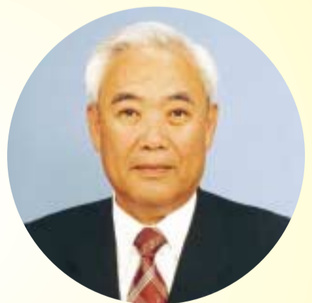
市長 久村 哲

明けましておめでとうございませう。 市民の皆さまには、新たな世紀の幕開けを、健やかに迎えることとお慶び申し上げます。 本市は新世紀の息吹を感じさせる事業を着実に進めており、昨年は、介護保険制度の実施や京田辺駅舎の改築工事、JR三山木駅の高架工事をはじめ多くの事業を推進することができました。心から感謝申し上げます。 21世紀は、IT(情報技術)の推進によりインターネット社会が形成されると同時に心の豊かさや生きがいといった精神的な充足が求められる世紀であるともいわれております。 こうした社会的、時代的な要請を受けて、本市は心響くまちづくりをめざし、日々快適で安全な暮らしができる基本的な都市機能の整備はもとより、福祉や環境、情報公開、男女共同参画などソフト面の施策 や事業にも力点を置いた、常に時代に即応した街の創造に取り組んでまいりたいと考えております。 依然として厳しい社会経済情勢ではありますが、残された行政課題の解決に全力で取り組むとともに、時代の大きな変化の中で、急速に進む少子・高齢対策、介護保険制度への対応、地方分権・行財政改革の推進(ごみや廃棄物等の環境問題など、新たに対応すべき課題を的確に捉え、これまで築き上げてきた様々な経験やシステムを駆使しながら新しい時代に希望を持つていただける、明るいまちづくりを進めてまいりたいと考えております。 豊かな自然を守り育てながら、みんながゆとりとほほえみのもてる素敵な街の明日のために、新たな一歩を記していきたいと思っております。 本年が、皆さまにとって素晴らしい一年となりますことを心より祈念いたしまして、新年のごあいさつといたします。