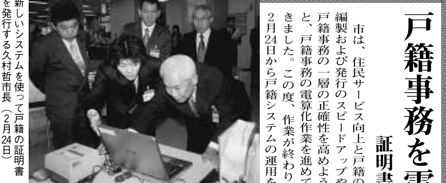
新しいシステムを使って戸籍の証明書を発行する久村哲市長(2月24日)

水道部は、次のとおり上水道指定工事店の追加と廃止を行います。上水道指定工事店(市)：タカラハウジング：城陽市久世南垣6・6(☎56・6900) 柳大輝設備工業：寝屋川市太秦緑が丘27・21(☎072・823・445) 事業廃止の届出があった上水道指定工事店(市)：服部設備工業：城陽市久世北垣内136・10(☎52・4588)