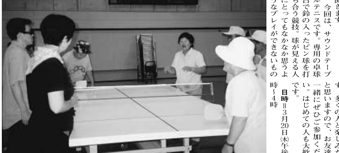
鈴の入ったピン球を打ち合うサウンドテーブルテニス

候補者などや後援会が選挙区内にある人に対して、あいさつ状を配布することはできません。③あいさつ状は禁止 候補者などが選挙区内にある人に対して、寒中見舞いなどを出すことも禁止されています。④飲料水の提供は禁止 飲食物の提供が禁止されています。