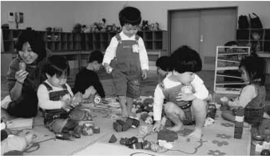
遊具で遊ぶ子どもたち(普賢寺児童館で開かれた親子教室)