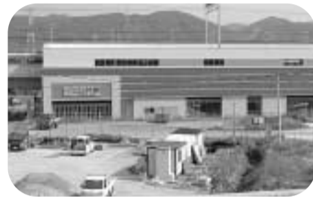
三山木地区特定土地区画整理事業を中心に三山木駅周辺を開発

「地域包括支援センター」を老人福祉センター常磐苑内に併設 介護予防マネジメント、包括的・継続的なマネジメントの支援及び虐待防止・権利擁護事業の実施を含めた総合的な相談窓口の開設 「京田辺市障害者生活支援センター」を近鉄新田辺駅前に開設 在宅での障害のある人の地域生活を支援する中心的な役割を担う施設。また、障害者自立支援法の施行に伴い、各サービスや地域生活支援事業等の提供体制の確保を図るため「障害福祉計画」を策定