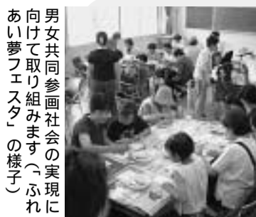
男女共同参画社会の実現に向けて取り組みます(ふれあい夢プロジェクト)の様子

「(仮称)女性交流支援ルーム」を平和堂アル・プラザ京田辺店内に設置 「女性の相談室の充実と情報提供体制の整備」に対応する 「京田辺市地域福祉計画」に基づき市民相互の支えあいを大切にした福祉のまちづくり全ての市民が健やかで安心して暮らせる地域社会の実現をめざす