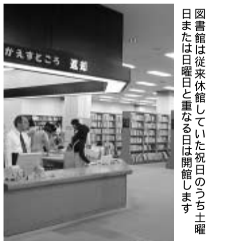
図書館は従来休館していた祝日のうち土曜日または日曜日と重なる日は開館します