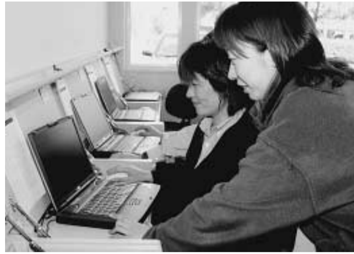
「分かりやすい」と好評なIT講習会。あなたも受講しませんか