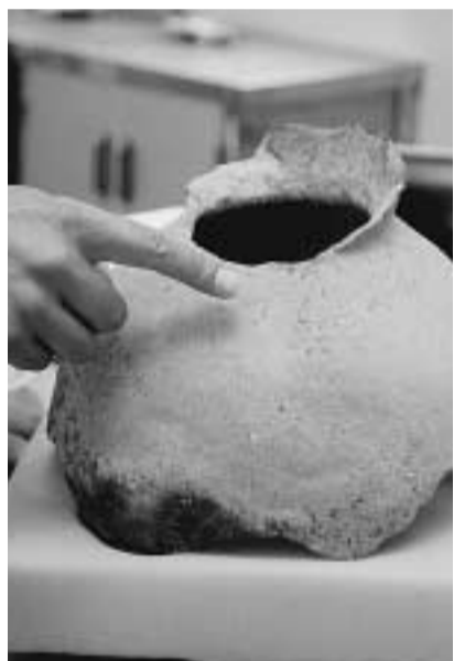
表面に連続した三角形紋がある土器