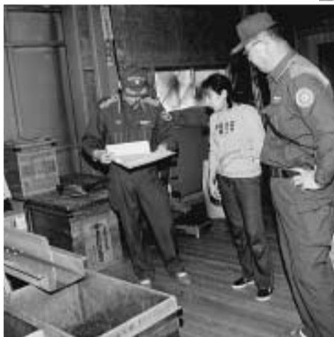
茶工場を防火査察する消防署員(5月15日)

満足な様子。また、「入賞できるよう、茶づくりを力強く話されました。また、消消暑は新茶シーズンを迎えた事か