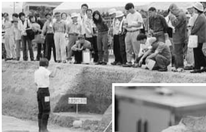
5月18日に行われた現地説明会で調査員から説明を受けるみなさん(社会福祉センター北側)

教育委員会は水道部事務所新築工事予定地で発掘調査を行ったところ、平安時代の掘立柱建物跡や古墳時代中期の絵画土器などが見つかったと発表しました。 調査地は社会福祉センター北側の580平方メートル。このあたりは、南山城でも有数の遺跡として知られる興戸遺跡の一角です。これまでの調査で、縄文時代晩期から中世にかけての遺構や遺物が数多く見つかっています。 今回見つかった掘立柱建物跡は、柱の掘りかたも方形で大きくその間隔も広いことから、一般的でない建物であると推測されます。また、絵画土器は、表面に連続した三角