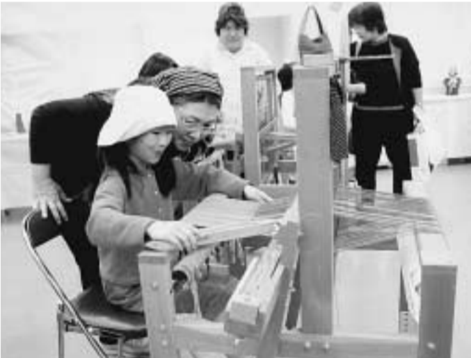
さをり織りを体験する来場者(社会福祉センター)

緑の風まつりこのまちで働き、このまちで暮らす(主催)同実行委員会・たなべ緑の風作業所 会場では、ボランティア 所が5月17日に社会福祉センターで開かれまし アなどによる模擬店やステーション発表、作業所利用者が作った陶芸作品や手すきはがき、ごみ袋などの販売なども行われ、来場者約400人は利用者との交流を楽しみました。 このイベントを主催した知的障害者通所授産施設たなべ緑の風作業所は、現在43人の利用者が通所、軽作業や生活訓練などを行っています。 作業所が利用者の増加によって手狭になることから、第2作業所の建設なども計画されており、それらを市民のみならず、理解していただくよう行われたものです。