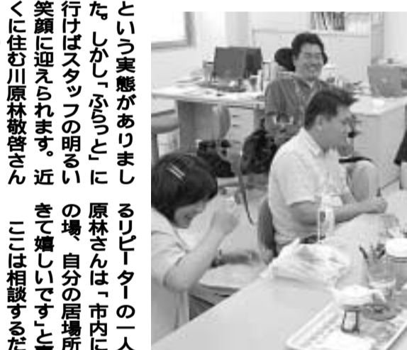
スタッフと歓談する利用者

には、テーブルがあり誰もが気軽に立ち寄ることができる場所として開放しています。オープン2か月で延べ200人以上の人が来所。ここを訪れた人の理由は、就労の相談や福祉サービスの相談が多い。しかし一番の理由は本当に「ふらっと」を訪れた人が多いという。これまでに宅生活を送っていたため、なかなか話を聞いてもらえない場所がなく、話し相手はいつも家族ばかり