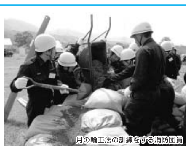
梅雨入り前の5月27日、飯岡の木津川堤防で水防訓練が行われ、消防団員149人、消防本部職員64人、一休ヶ丘や飯岡区の自主防災会から70人が参加しました。