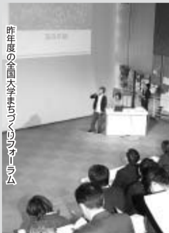
昨年度の全国大学まちづくりフォーラム

京の夢未来体験活動推進事業...896 豊かな人間性や社会性を育むため、児童生徒が、仕事に関わる体験活動や職場体験などを行う 全国大学まちづくりフォーラム開催費...500 全国の大学生などが政策を多角的に議論することにより、本市をはじめとする全国の自治体の活性化に寄与する 中央公民館施設用備品...1,500 照明設備の改善などにより利用範囲が拡大した中央公民館大ホールで使用する机や収納用台車などの備品を購入する 社会体育協会育成補助...1,900 社会体育協会の法人格取得を支援する 三山木区画整理公園整備事業...91,700 三山木地区の特定土地区画整理事業が進捗する中、事業区域内に予定している4つの公園のうち2つの公園について整備を行う 市制10周年記念事業...9,100 市制10周年の記念すべき年にあたり、市民とともにこれまでの歩みを振り返り、さらなる飛躍の第一歩とするため、記念式典・記念表彰などを行う