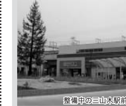
整備中の三山木駅前広場

甘南備園バグフィルター布交換...50,060 運転開始から6年を経過する環境衛生センター甘南備園のバグフィルターろ布を交換し、施設の機能維持と排出基準を保つ共同利用施設等整備補助...2,745 農作業の受託組織や農産物の共同加工販売組織が購入する農業用機械などの購入費の一部を助成する農業農村活性化経営体づくり補助...9,130