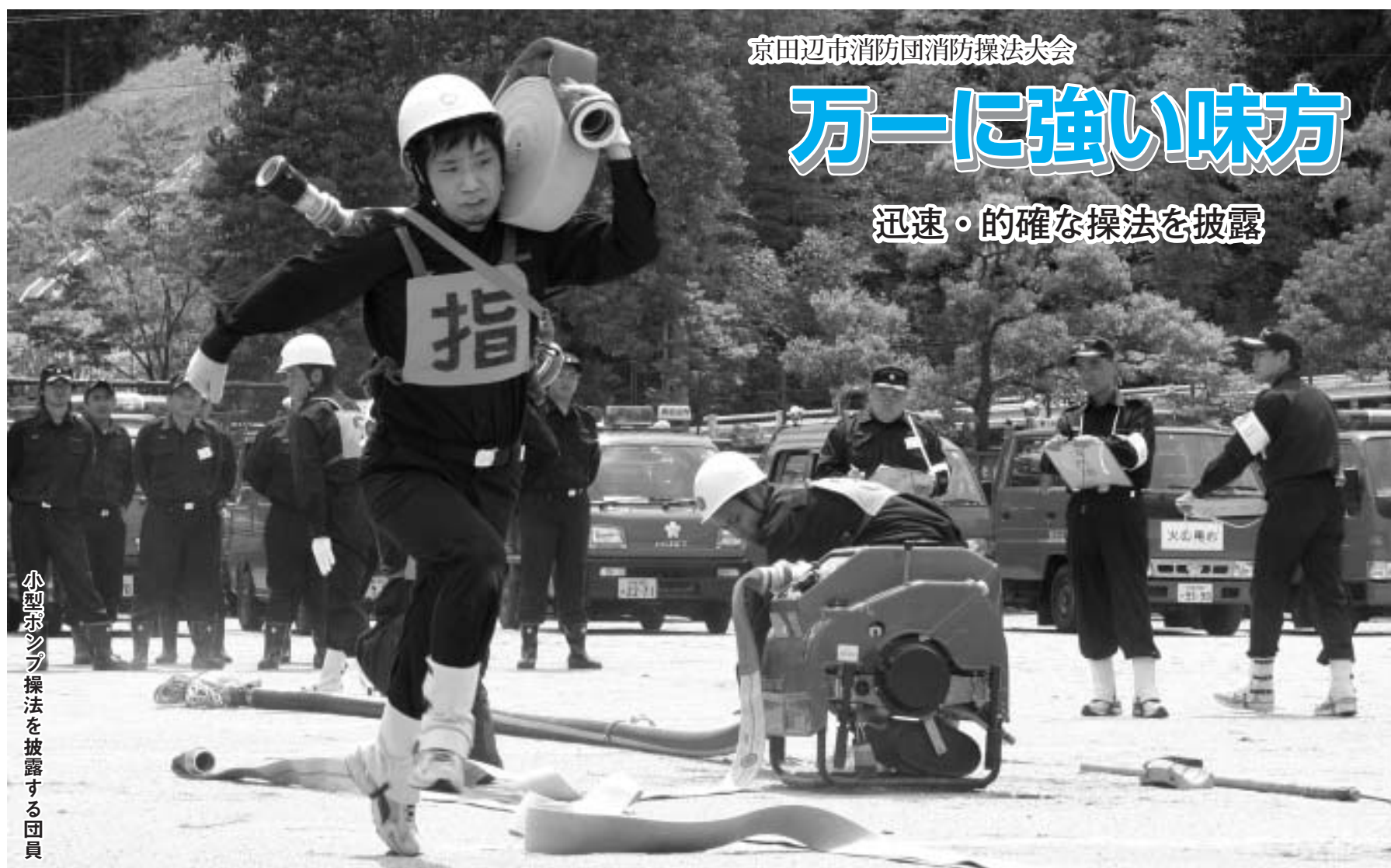
京田辺市消防団消防操法大会