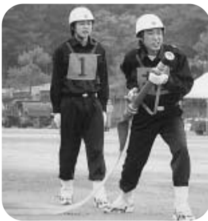
小型ポンプ操法の訓練成果を発揮する消防団員(新小学校)

梅雨空のもと、市消防団消防操法大会が7月6日に新小学校グラウンドで行われました。本大会は、消防団員の技術の向上と、士気を高めるために2年に1回開催されるもの。