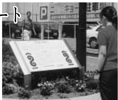
大住隼人舞のプレート。1度ぜひご覧ください

同プレートは、田辺地区特定土地区画整理事業に終結のメドがついたことから今年4月に設置したもので、プレートは幅115、高さ60センチのアルミ製です。通りかかられた折りには、ぜひご覧ください。