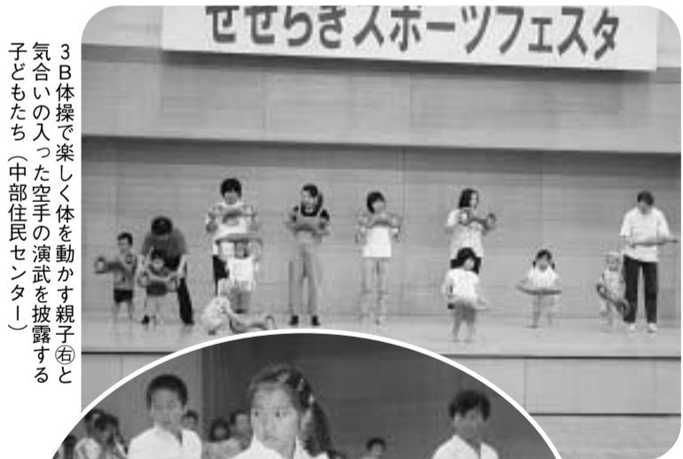
3B体操で楽しく体を動かす親子(右)と、気合いの入った空手の演武を披露する子どもたち(中部住民センター)

7月12・13日に、中部住民センターでせせらぎスポーツフェスタが開かれました。これは地