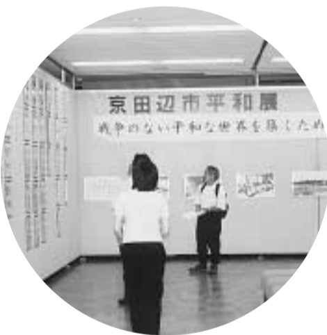
この機会に平和の尊厳について考えてみませんか(昨年の平和展・コミュニティホール)

市平和都市推進協議会 内容は、平和の尊厳を広く市民に訴え、後世に伝えるため「京田辺市平和のつどい・平和展」を開きます。 平和のつどい 日時 8月6日(水)午前9時30分～正午 場所 市平和都市推進協議会(総務課内、〒64-1326) 平和展 日時 8月6日(水)～9日(土) 時間 午前10時～午後4時。ただし、6日(水)は午後1時から、9日(土)は正午までです。 平和映画会 日時 8月6日(水)～15日(金) 内容 8月8日(金)午後2時から「火垂るの墓」 9日(土)午前10時30分から「戦場の小さな天使たち」