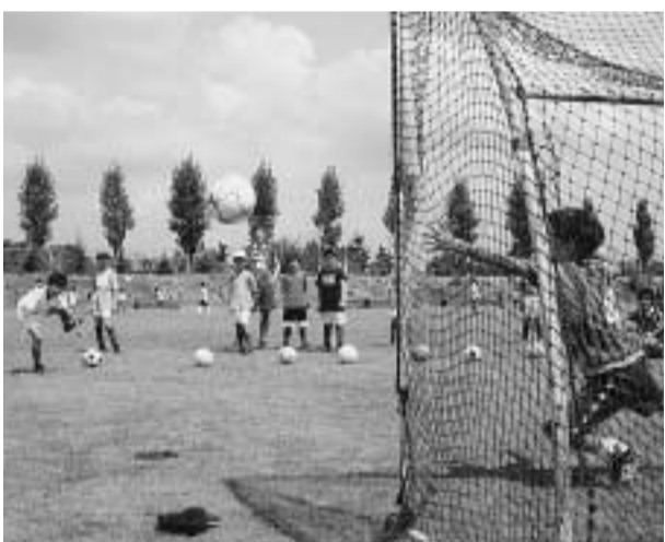
現役選手に教えてもらい力いっぱいシュート！(同志社大学京田辺キャンパス陸上競技場)