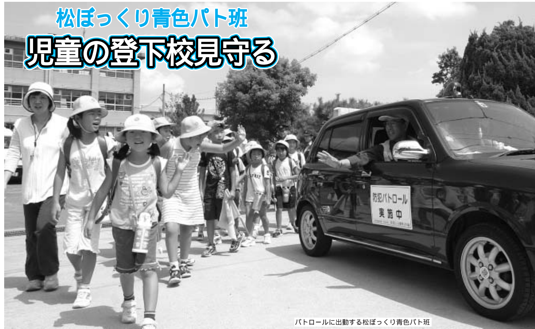
パトロールに出動する松ぼっくり青色パト班