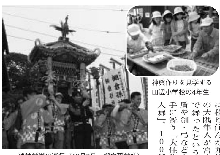
瑞鎮神輿の巡行 (10月8日、棚倉孫神社)

8日(木) 薪小 (☎63-2000) 13日(火) 三山本小 (☎62-1055) 15日(木) 松井ヶ丘小 (☎62-8888) 大住小 (☎62-0046) 20日(火) 田辺小 (☎62-0044) 22日(木) 田辺東小 (☎62-4348) 27日(火) 草内小 (☎62-0054) 消費生活相談 弁護士事務所を差出人とする身に覚えのない請求が送られてくる事例が増加しています。お気軽に相談してください。 健康介護課 (☎64-1335) 社会福祉協議会 (☎62-5447)