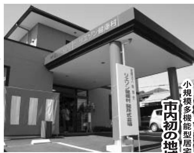
10月にオープンしたリゾン健康村

平成18年4月の改正介護保険法施行で導入された新サービスで、「泊まり」を組み合わせ、「小規模多機能型居宅介護」の施設「リゾン健康村」が、10月、市内の第1号として開所しました。今後、地域密着型サービスの新たな担い手として期待されています。