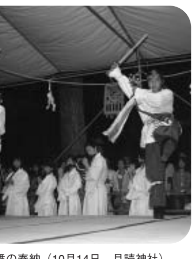
大住準人舞の奉納 (10月14日、月読神社)

市指定文化財各地で奉納 豊作に感謝・無病息災を祈願 本市では、4つの伝統行事を市指定無形民俗文化財として、宮ノ口地区の八人衆が、毎年「瑞鎮神輿」を、毎月初日(現在は第一日曜日)に奉納する。この瑞鎮神輿が作られる様子を見学しよう。10月3日には、田辺小学校の3、4年生が棚倉孫神社を訪れました。子どもたちは、製作がたいがい、豊作を感謝し、野菜や果物を身近に色とりどりの殺物や野菜など飾られた神輿