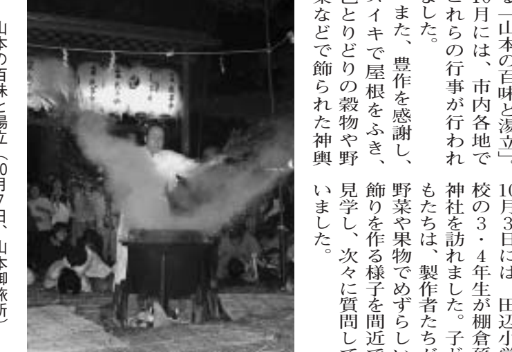
大住準人舞の奉納 (10月14日、月読神社)

豊作に感謝・無病息災を祈願 本市では、4つの伝統行事を市指定無形民俗文化財として、宮ノ口地区の八人衆が、毎年「瑞鎮神輿」を、毎月初日(現在は第一日曜日)に奉納する。この瑞鎮神輿が作られる様子を見学しよう。10月3日には、田辺小学校の3、4年生が棚倉孫神社を訪れました。子どもたちは、製作がたいがい、豊作を感謝し、野菜や果物を身近に色とりどりの殺物や野菜など飾られた神輿