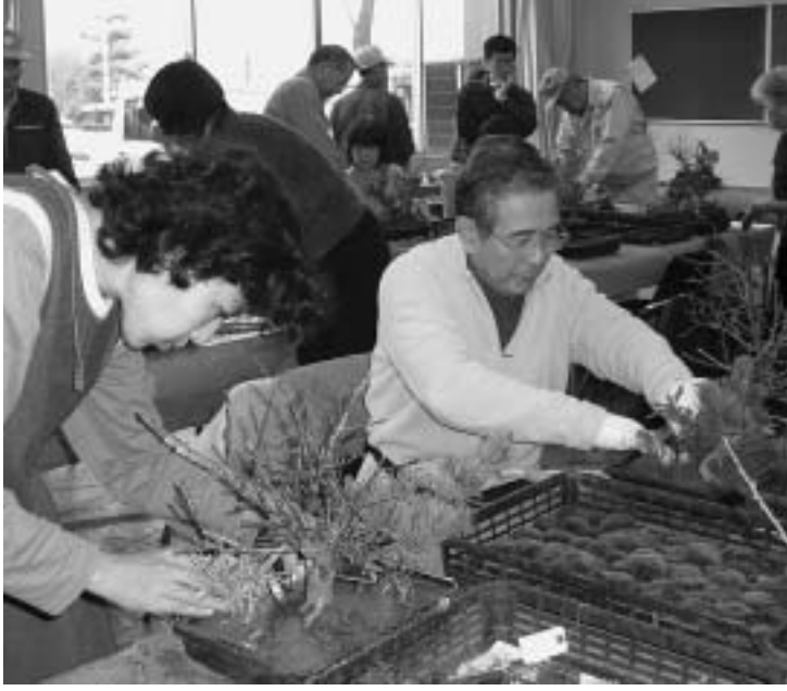
昨年の正月用盆栽講習会

申込資格は、本市に住民登録をし、1年以上住んでいる世帯主で、暮らしに必要な生活資金・療養資金などが一時的に必要な人。ただし、夏期・歳末くらしの資金償還の返済が終わっていない人や市の貸付金(生活更