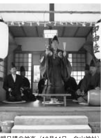
朝日講の神楽 (10月14日、白山神社)

豊作に感謝・無病息災を祈願 本市では、4つの伝統行事を市指定無形民俗文化財として、宮ノ口地区の八人衆が、毎年「瑞鎮神輿」を、毎月初日(現在は第一日曜日)に奉納する。この瑞鎮神輿が作られる様子を見学しよう。10月3日には、田辺小学校の3、4年生が棚倉孫神社を訪れました。子どもたちは、製作がたいがい、豊作を感謝し、野菜や果物を身近に色とりどりの殺物や野菜など飾られた神輿