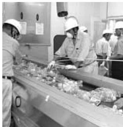
ペットボトルを選別するリサイクルライン

た甘南備園でしたが、この施設ができたことで多種多様なごみ処理、ごみの再資源化または環境保全対策が可能となり大きく生まれ変わりました。リサイクルプラザは、資源物を分別処理する「リサイクル工場棟」と、ごみの減量や資源化についての学習や実習が行える「プラザ館」の二棟からなる複合施設です。