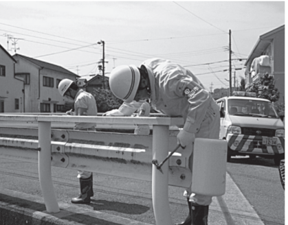
点検箇所を入念に確認しました

その結果、外部に発注すれば500万円ほどかかる経費の支出を抑えることができました。なお、調査結果は「長寿命化修繕計画」を検討する基礎データとします。