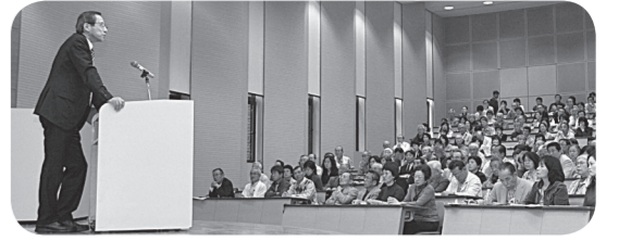
開講式後の講演に聞き入る参加者

康科学部」が新設されたことを記念し、「命と健康の尊さ、医科学とスポーツ科学の観点から」をキーワードに、日常生活で関心を持つテーマを取り上げた講座が7回予定されています。この講座には、毎年市内外から多くの参加があり、今年は過去最高の717人の申し込みがありました。