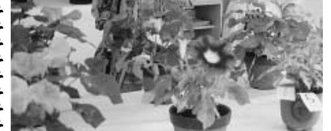
早朝から咲競うアサガオを見るみなさん(中央公民館)

文化協会と中央公民館は、花い を8月3日に開き、3つの部門に つばい運動の一環としてアサガオ 72点の参加がありました。 作りを広めよう」とあさがお展 各部門の入賞者(1等)は次の とおりです。