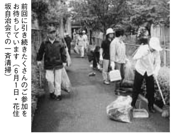
前回に引き続きたくさんのご参加をお待ちしています(6月1日・花住坂自治会での一斉清掃)