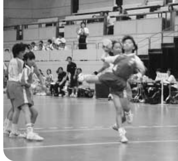
女の子も負けじと、飛び込んでの豪快なシュート!