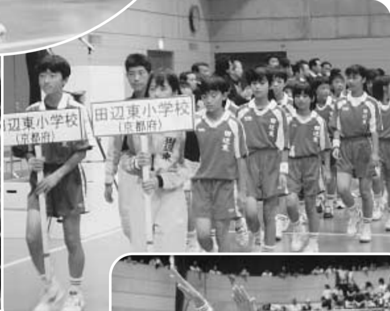
堂々と入場行進をする選手のみなさん