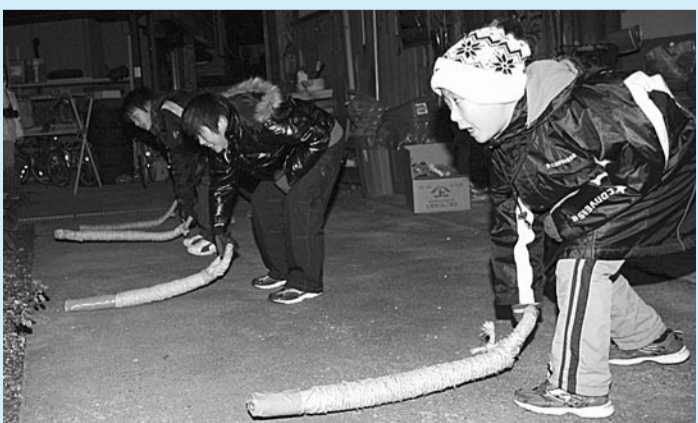
寒さに負けずモグラを退治する子どもたち(江津地区)

子どもたちは、同保育所内にある畑のモグラを退治しようとして、大きな声で歌を歌い、横槌で力いっぱい地面をたたいていました。 1月11日の夜は「おんころどん」の本番。江津地区と宮ノ口地区の子どもが、それぞれの地域の家を2〜3時間かけて回りました。 江津地区では、地域の人や両親が手作りした横槌を手にとり、各家を訪問。「今年も例年どおり、おんころどんをさせてもらいます」と玄関先であいさつ。子どもたちの元気な歌声と横槌で地面をたたき、音が響き渡っていました。