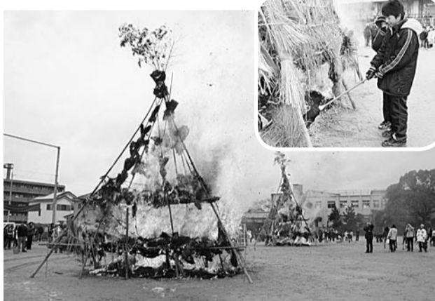
たくさんの願いを込め、とんに点火