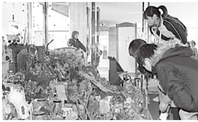
5歳児が作った共同作品

会場に入ると、「わかしばなし〜おにのでてくるおはなしから〜」と書かれた垂れ幕の下に、