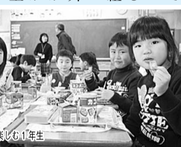
初めてのどんど焼きを楽しむ1年生

現在、ふるさと田辺体験学習推進委員会が主催。前日からグラウンドで推進委員・民生児童委員・田辺区PTAら約50人が竹などを使って6メートル近い高さのとんどを2基組み立てました。