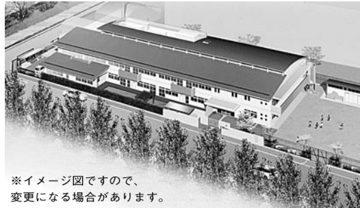
※イメージ図ですので、変更になる場合があります。

また、大住保育園に続く2カ所目の地域子育て支援センターの設置も予定しており、子育て支援の拠点として、地域に根ざした保育所にしていきたいと考えております。