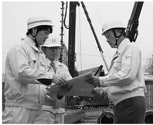
④河原保育所の完成予想図 ⑤現場を見て確認