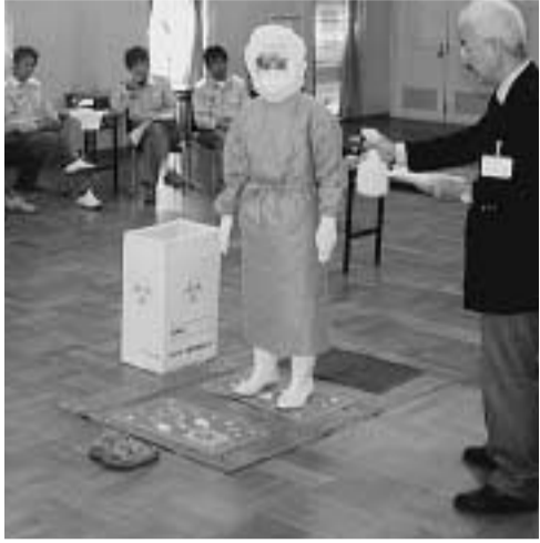
田辺保健所職員から防護服の消毒方法を学ぶ職員ら(コミュニティホール)

市は、重症急性呼吸器症候群(SARS)が発生した時に、患者搬送や消毒作業を担当する職員を対象に研修会を昨年12月3日に開きました。 SARSは、一昨冬にアジアを中心に発生した、新しく発見された病気で、今年も冬場にかけて再流行する恐れがあるとされています。 研修会に参加したのは、SARS発生時に第一線で作業をすることとなる消防職員と健康推進課職員ら約50人です。 研修会では田辺保健所職員を講師に迎え、SARSの感染経路やその症状、発生時の対応や消毒方法などについて学びました。 患者搬送や消毒時に着用する防護服や手袋などを脱ぐ時がもっとも二次