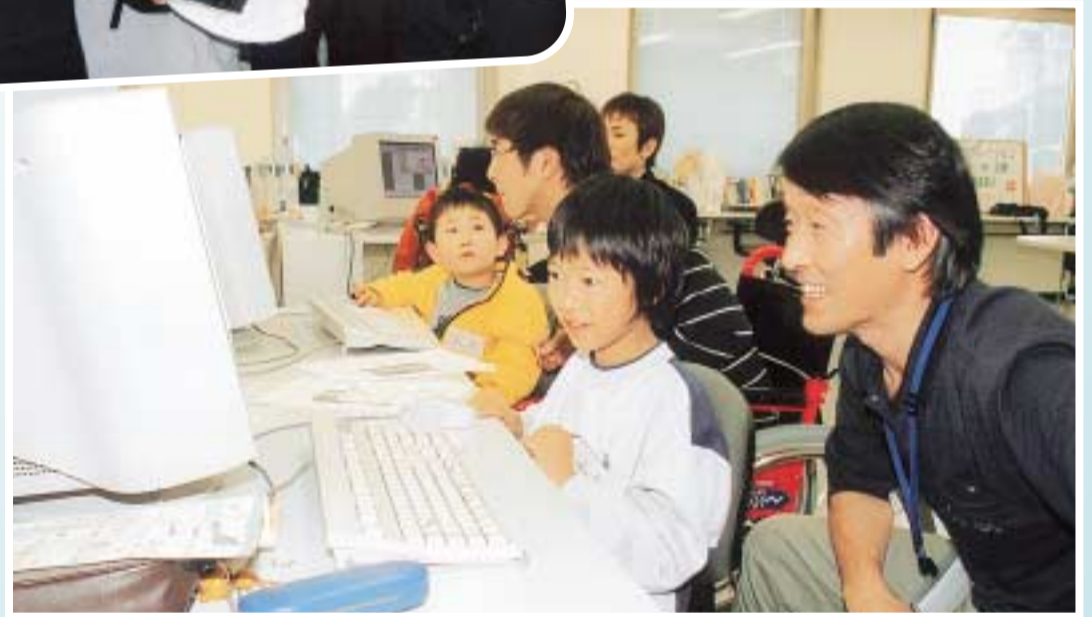
スタッフに教えてもらいながらパソコンを使って年賀状を作る参加者

IT業務を主な事業とする共同作業所「アイ・コラボレーション京都」は、小学生を対象にふれあいパソコン教室を開催。参加者はスタッフからパソコンの手ほどきを受けながら、お気に入りのイラストや写真などをデザインして、オリジナル年賀状を作成しました。時間がたつにつれて緊張感がほぐれ、わいわいと楽しくお互いに協力しあいながら年賀状を完成させました。