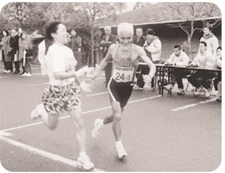
みんなでたすきをつなぎましょう

区間・距離：6区間・スタート時間：女子9時45分、男子10時 コース：第1区：松井ヶ丘小学校 京都社会保険労務士事務所(3.5km) 第2区：同事務所 田辺中央体育館(2.6km) 第3区：観音寺(3.5km) 第4区：JA京都やましろ(2.2km) 第5区：同事務所 田辺南支店普賢寺(2.2km) 54人 申込方法：人権啓発課に入場整理券を取りに来てください 問合せ先：人権啓発課 (☎64・1336)