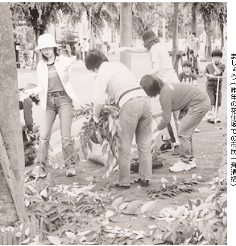
次の世代に美しいふるさとを引き継いでいきましよう(昨年の花住坂での市民一斉清掃)

「私たちのまちは、私たちが美しく」を趣旨に活動する、わがまち「京たなべ」を美しくする会は、平成16年度の会員を募集します。 日々の暮らしを一層潤いのあるものとするため、私たちが自らごみを拾い、草刈りなどをし、美しいふるさとを次の世代に引き継いでいきたいと思います。 多くのみなさんのご入会をお待ちしています。 会費(一口・年額) = 個人...300円 団体...3000円以上 申込方法 = 区・自治会やわがまち「京たなべ」を美しくする会事務局へ申し込んでください しめきり = 3月31日(木) 申込・問合せ先 = わがまち「京たなべ」を美しくする会事務局(総務課内、☎64-1326)