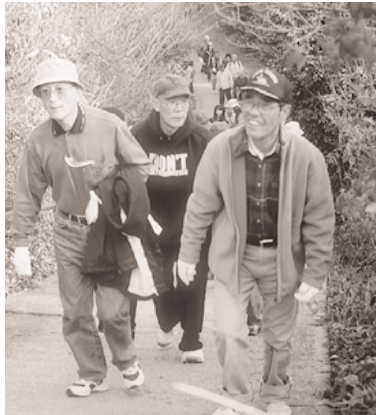
元気いっぱい甘南備山を登るみなさん

「新春甘南備山初登り」が1月3日に行われ、約800人が山頂を目指して歩きました。毎年恒例の初登りも今回で40回目。今年は天候にも恵まれ、例年より暖かい日差しの中、参加者のみなさんは朝早くから京田辺駅・新小学校を出発。子どもからお年寄りまでたくさんの人が元気に甘南備山を登りました。山頂に到着したみなさんは、互いに新年のあいさつをし、甘南備神社でお参りをした後、全員で「京田辺市の歌」を合唱。新年に向けて決意を新たにしていました。