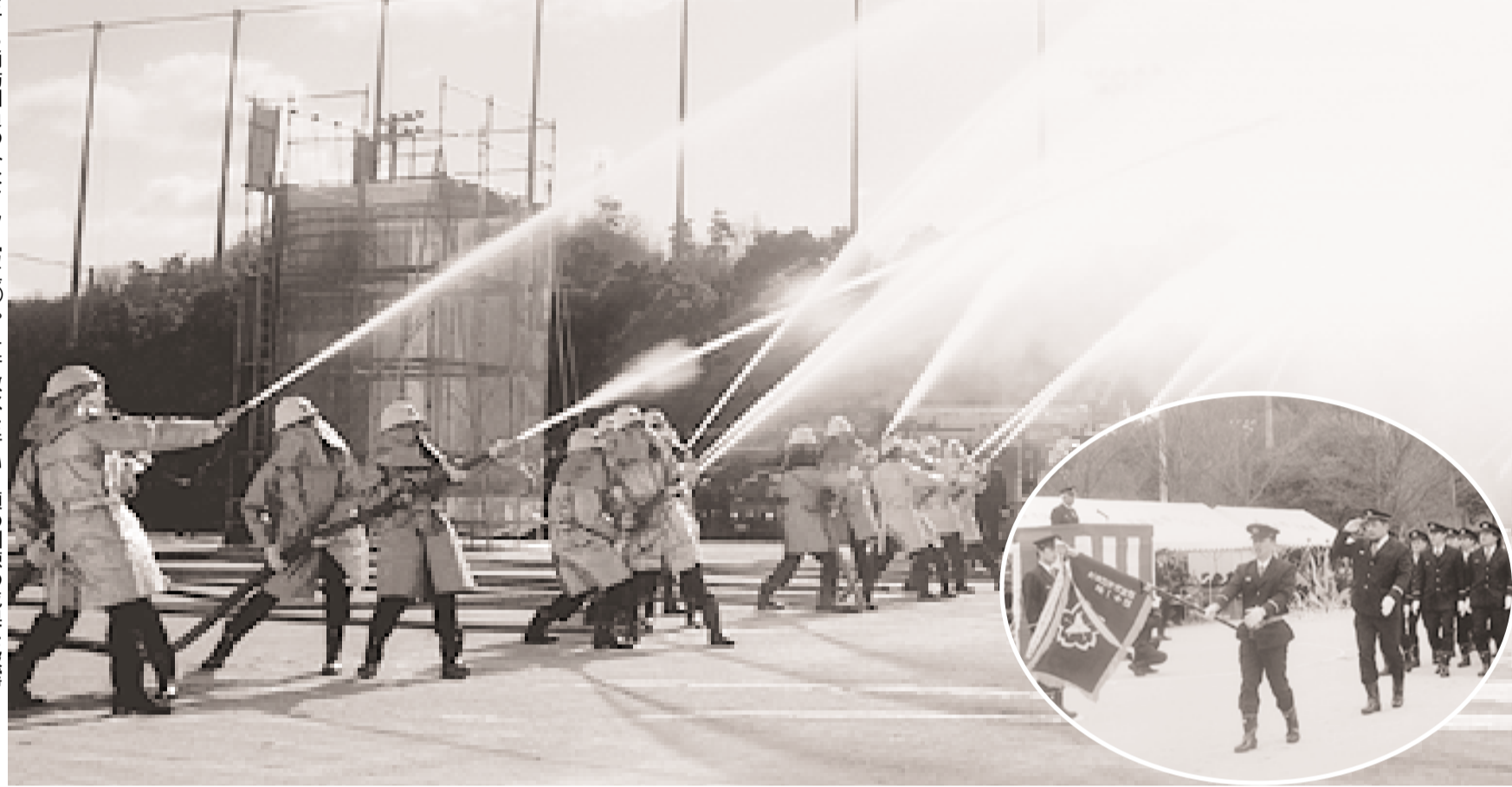
分列行進をする消防団員のみなさん(写真⑥)。一斉放水を行い日頃の訓練の成果を披露しました(田辺公園多目的運動広場)