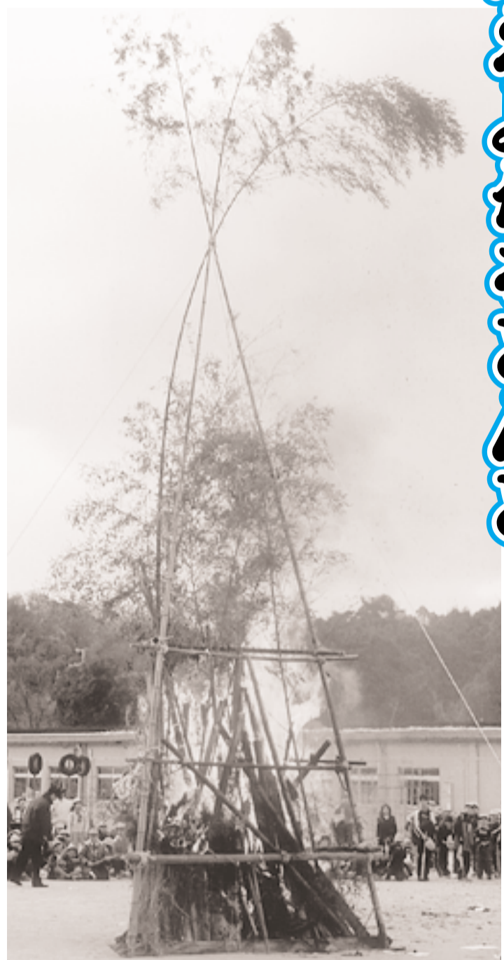
火の入った「とんど」を見守る児童ら(大住小学校グラウンド)

お正月に使った門松やしめ縄などを集めて燃やす「とんど」が、市内各地で行われました。 1月8日(日)大住小学校で行われた「とんど」の様子