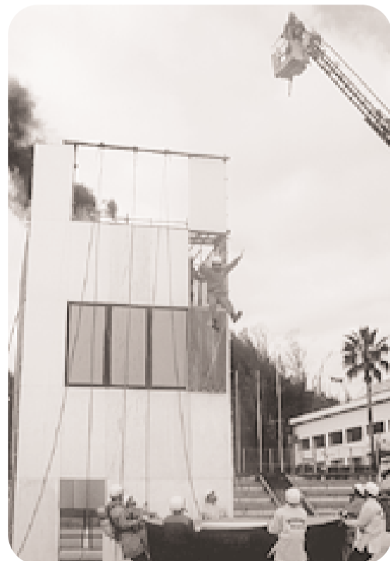
中高層火災を想定しての訓練を行う消防署職員

「新春甘南備山初登り」が1月3日に行われ、約800人が山頂を目指して歩きました。毎年恒例の初登りも今回で40回目。今年は天候にも恵まれ、例年より暖かい日差しの中、参加者のみなさんは朝早くから京田辺駅・新小学校を出発。子どもからお年寄りまでたくさんの人が元気に甘南備山を登りました。山頂に到着したみなさんは、互いに新年のあいさつをし、甘南備神社でお参りをした後、全員で「京田辺市の歌」を合唱。新年に向けて決意を新たにしていました。