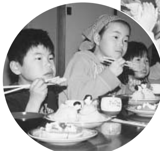
おひなさまに見立てて作ったひなずしを食べる子どもたち

京田辺生活学校が伝統料理を伝える。最近の子どもたちの情緒不安定が原因とみられる事件が、家庭での食生活の乱れが影響の一つではと考える「家族一緒に食べることを大切さをせひ知ってほしい」との願いを込めて、京田辺生活学校は各地域の子どもたちに伝統料理を伝えるのまわりに卵を巻いて、おひなさまの服を作るのが難しく「おひなさまの服を作るのが難しく」と話しながら、ウズラ卵にのりやゴマで髪の毛と目を作って顔に見立て、おにぎりの上にのせる。試食会では、生活学校によるおひな祭りの由来も紹介されました。