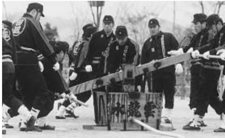
消防ふれあいフェアでは消防団員らが昔の消防機材を使った訓練を披露④最新鋭の救助工作車や高度な救命措置ができる高規格救急車・はしご車なども展示します