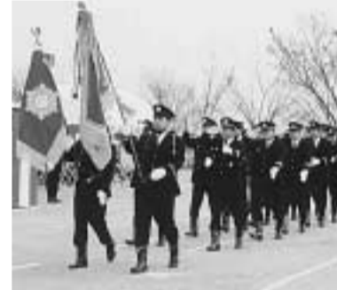
消防団員による分列行進(平成12年消防出初式・田辺公園多目的運動広場)