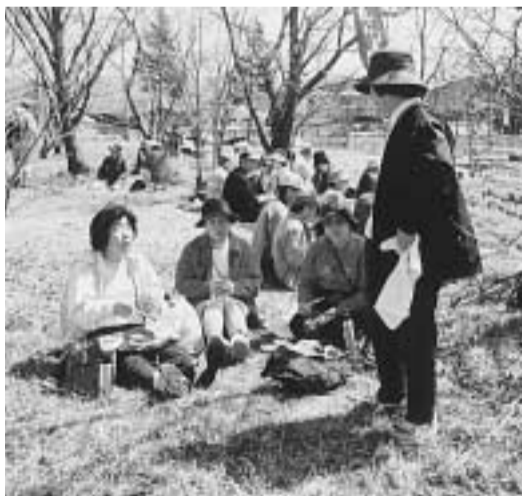
春の陽気のなか大御堂観音寺で昼食を楽しむ 昨年の花見ウォーク参加者

花見ウォーク 「歩いて、見て、食べて、時花を摘む!」市観光協会「ゴール」大御堂観音寺は一休寺から甘南備山を登り(近鉄三山木駅まで無料送迎バスを運行します)を一日ゆっくり歩きながら、いろいろなイベントに容れ、一休寺・午前9時、参加し楽しむ花見ウォーク 10時30分・野点、同寺拝観を閉じます。 日時=4月7日(土)午前9時~午後3時(雨天決行) 集合・受付・出発場所= 音寺・午前11時~午後3時(一休寺)同寺には駐車場が、竹の子鍋、琴演奏、菜ありませんで、公共交通機関をご利用ください) 受付時間=午前9時~10時 参加料= 大人500円