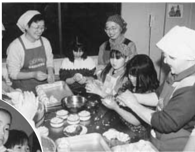
ちらしずしでおにぎりを作る参加者たち（三山木福祉会館）

京田辺生活学校が伝統料理を伝える。最近の子どもたちの情緒不安定が原因とみられる事件が、家庭での食生活の乱れが影響の一つではと考える「家族一緒に食べることを大切さをせひ知ってほしい」との願いを込めて、京田辺生活学校は各地域の子どもたちに伝統料理を伝えるのまわりに卵を巻いて、おひなさまの服を作るのが難しく「おひなさまの服を作るのが難しく」と話しながら、ウズラ卵にのりやゴマで髪の毛と目を作って顔に見立て、おにぎりの上にのせる。試食会では、生活学校によるおひな祭りの由来も紹介されました。