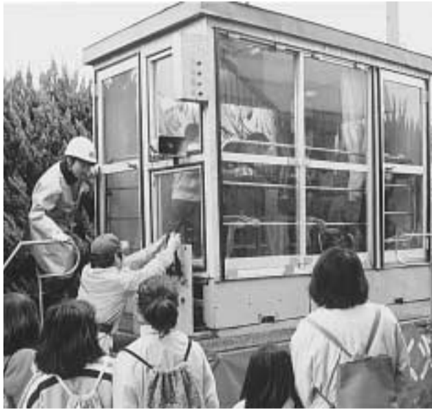
震度7の揺れが体験できる起震車。消防ふれあいフェアで体験できます(昨年の東区消防広場から)