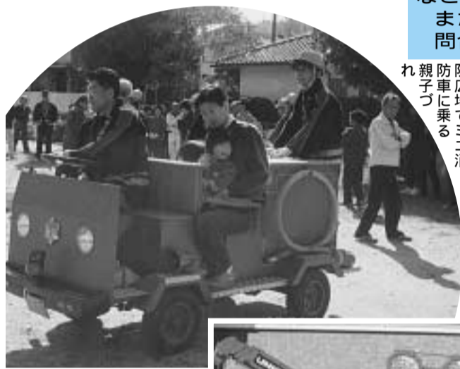
昨年11月に行われた一休ヶ丘消防広場でミニ消防車に乗る親子づれ