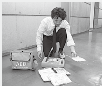
コンパクトに持ち運べる AED

申込方法=田辺中央体育館の申請書を提出してください。なお、貸出期間が重複するときは、貸し出しをお断りする場合があります。申込・問合せ先=田辺中央体育館 ☎62-1501