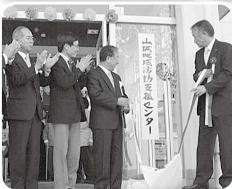
関係者による看板の除幕

聴覚に障害のある人の地域での生活を支援するため、山城地域活動支援センターがオープン。元京都府農業総合研究所花き部の建物をバリアフリー化し、3月から利用が始まっています。同センターでは、聴覚に障害のある人が、創作活動・生産活動・健康学習などのさまざまな学習ができる場を提供。また、地域で安心して暮らせるように生活相談に