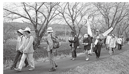
ゴミを拾いながらウォーキングしませんか

きょうたなべ環境市民パートナーシップは、第10回エコ・ウォーキングを開きます。遠藤川と普賢寺川沿いを歩き、史跡を探索します。コース途中でゴミ拾いと両河川の水質も調べます。雨中止