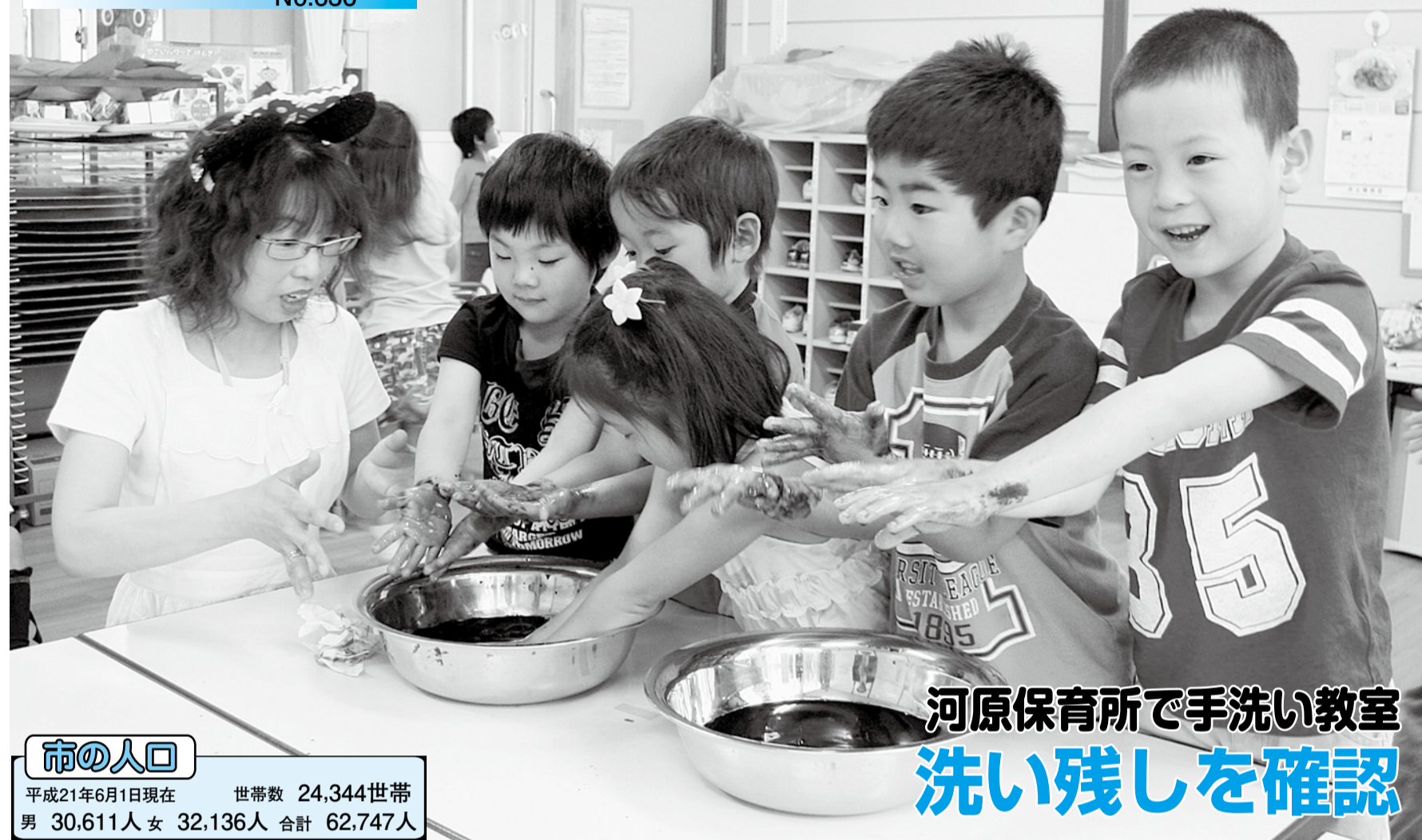
河原保育所で手洗い教室 洗い残しを確認

博士と助手の「魔法のくすり」と称したでんぶん糊を手につけ、普段通りに手洗い。次に、「魔法の水」と称したイソジンの希釈液に漬けると洗い残しが真っ黒に染まり、子どもたちはビックリ。その後、みんなで正しい洗い方を確認しながら、ツメや指の間など黒くなった箇所をきれいに洗い流しました。