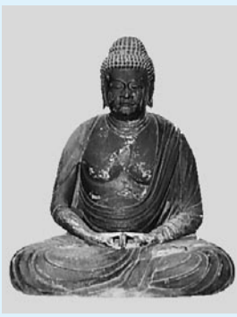
阿弥陀如来坐像 (教念寺所蔵)

「木造阿弥陀如来坐像 教念寺所蔵」(一纏) 教念寺の本尊で高さ73・9cmの平安時代中期に製作された像です。教念寺は元禄5年(1692)開創と伝えられますが、それよりも古い像であり、くわしい伝来は不明です。