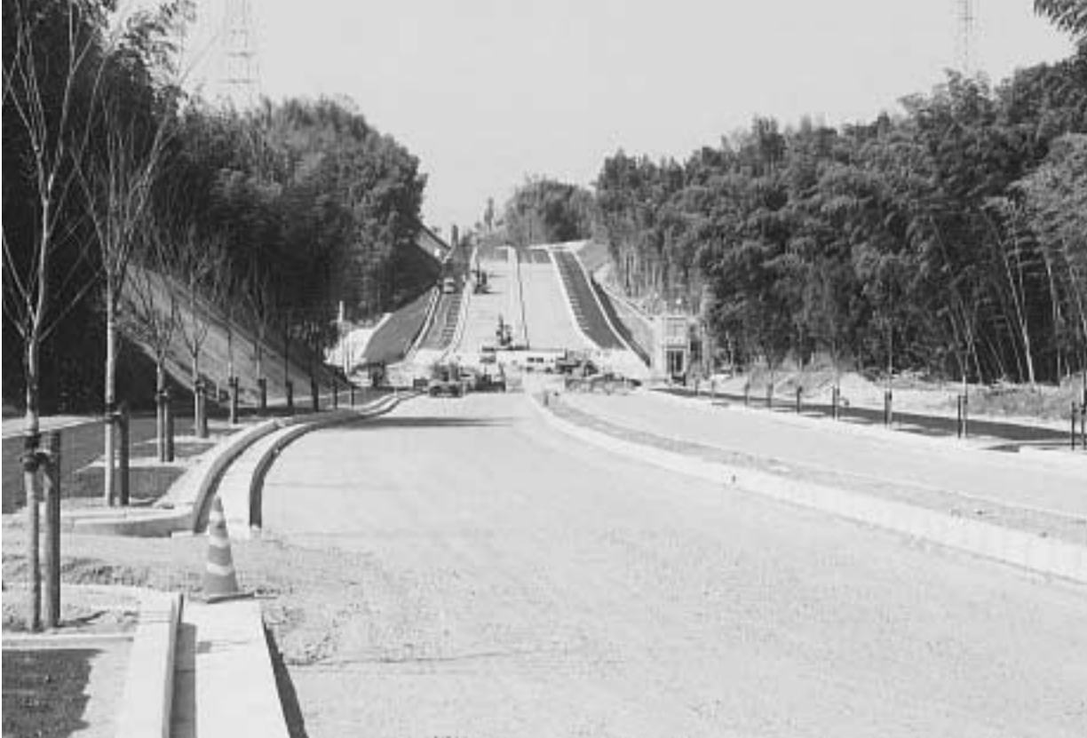
25日の開通に向け工事が進む山手幹線(同志社大学北側から田辺方面を望む)

京都府が府道八幡木津線のバイパスとして建設を進めている山手幹線のうち、国道307号から同志社大学京田辺キャンパスまでの間(田辺・興戸工区)1020mが完成し、4月25日午後3時から利用することができ、この区間の開通によって、本市域の山手幹線は約60%が通行できます。