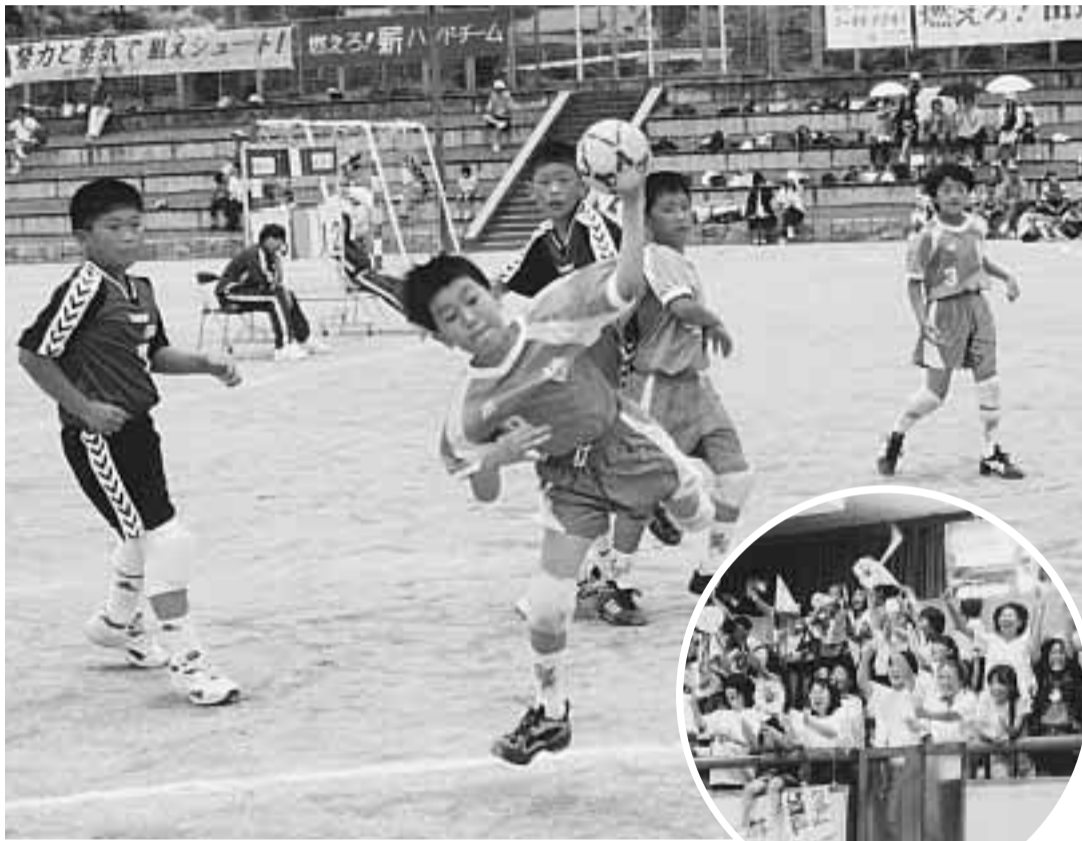
全国大会出場に向け熱戦を繰り広げた市小学生ハンドボール大会(6月9日、6年生男子予選の桃園小Aチーム対普賢寺小Aチーム・田辺公園多目的運動広場)