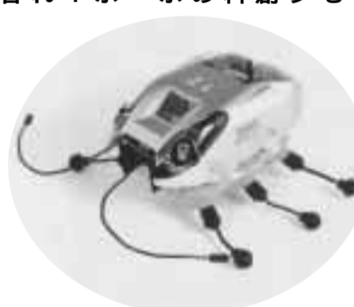
この虫型ロボットで速さを競う

【京都産業21など】 は、小・中学生に「虫型ロボット」の体験型プログラミングによる創造の楽しさを通じ、科学技術への関心を深めてもらうことを目的として、今年も「虫型ロボット」の競技会を開催します。 この競技会は、ロボット競技会、ロボットコンテスト、ロボットフェスティバル2001の競技会として行われるもので、上位入賞者は7月29日大阪国際会議場で開かれる、グラウンドチャンピオンシップに参加することができます。 日時：7月15日(日)午前9時30分～午後5時(受け付けは午前9時から) 場所：府立田辺高等学校 対象：市内に在住する小学校4年生から中学生で、大会当日に保護者の同伴が可能な定員20人(応募多数の場合は抽選で決定します。) 参加費：6,500円(キット代)当日徴収します。 応募方法：往復はがきの往信用紙に、氏名(ふりがな)・住所・学校名・学年・電話番号・同伴する保護者の氏名を返信用紙に住所・氏名を記載して送付してください。 しめきり：6月30日(土) (当日消印有効) 応募・問合せ先：京都府立田辺高等学校「虫型ロボット競技会」係(☎610・0331)京田辺市河原神谷24、☎62・0072 組み立てに必要な工具(ラジオペンチ、ニッパー、はさみ)は主催者が準備します。当日は弁当、筆記用具、上履を各自持参してください。