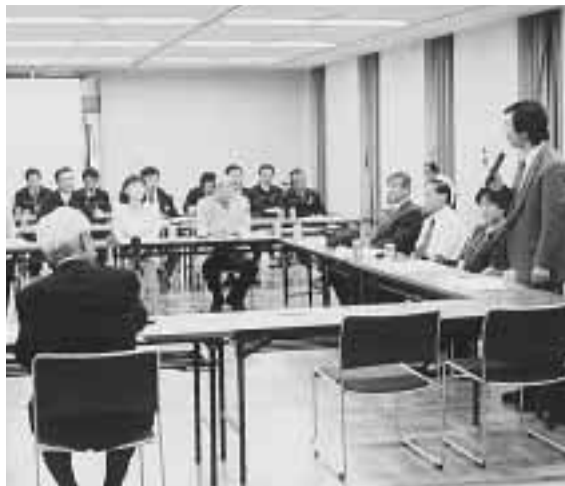
5月28日コミュニティホールで開かれた水道事業経営懇談会

市水道部は、市民のみなさんに水道事業の現状を理 市水道部は、市民のみなさんに水道事業の現状を理