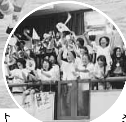
梅雨の晴れ間のなか、市内の9小学校から4・5・6年生の各部に男子26チームと女子24チームが出場。選手たちは、友だちや保護者らの声援を受けながら予選・決勝リーグやトーナメントで力いっぱいプレーを繰り返して、成績は次のとおりです。

市小学生ハンドボール大会(女子の部とも桃園小学から3日間、本市で開催され、6月9日と10日に田辺中央体育館と田辺公園多目的運動広場で開かれ、男子チームとともに、8月3日手にしました。