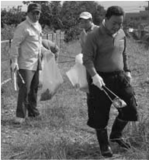
普賢寺川河川敷のごみを集める大和GREEN倶楽部のみなさん(9月19日)

「自分たちのまちを、自分たちできれいにしよう」を合言葉に、市内各地で清掃活動が行われました。本市では残念ながら、ごみのポイ捨てや不法投棄が数多く見られます。ごみを捨てさせないためにも地域ぐるみの取り組みが大切です。「広報きょうたなべ」では、市民が中心になって行われた3つの活動を紹介します。