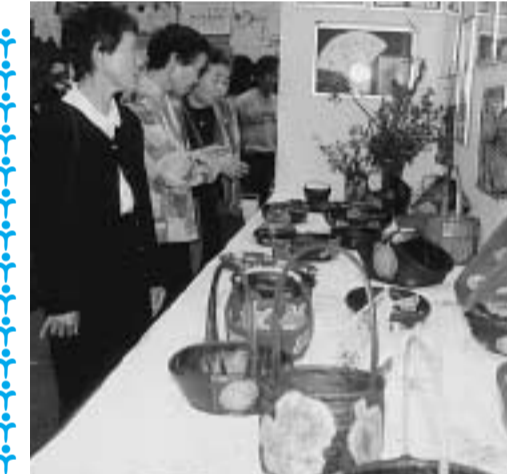
昨年の文化祭で展示作品を見る参加者(田辺中央体育館)