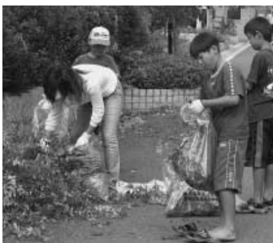
刈り取った木の枝を集める参加者のみなさん(9月26日、山手南四丁目)

環境美化に対する市民のみなさんの意識をより一層高め、住みよい生活環境づくりを進めようと「市民一斉清掃」が9月26日に開かれました。これは、市民と行政が一体となった清掃活動で、21の区・自治会などが参加。約5千人が道路や公園に散乱するごみや空き缶を回収したり、公園の雑草を刈り取るなど、クリーン作戦を展開し、約30のごみや雑草を回収しました。