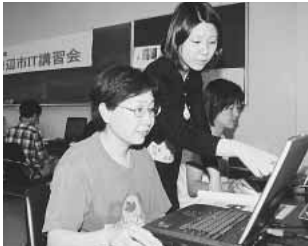
説明がわかりやすいと好評なIT講習会(中央公民館)