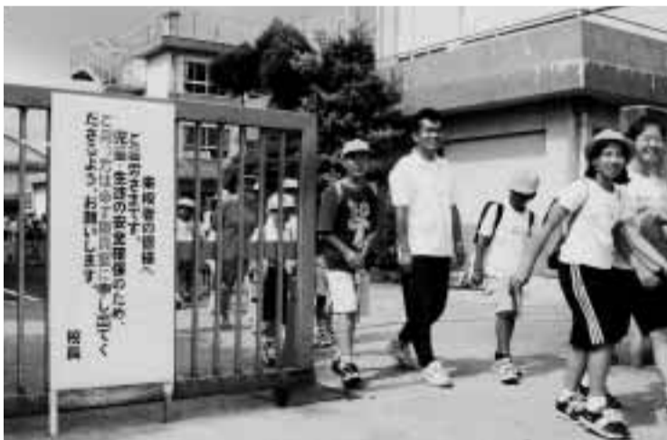
来訪者へのお願い看板が掲げられた校門の横を先生と一緒に下校する児童(田辺東小学校)

大阪府池田市で発生したうにあらためて協力依頼を市と教育委員会は6月12日に子どもの安全確保を目的にした緊急アピールを発表しました。 また、市と教育委員会は校門に「来訪者は職員室に申し出てください」と書いて看板を設置したり、各クラスに防犯ブザーを配布。は、8月3日(金)から3日間、「児童・生徒の安全をより市内で行われる全国大会へ図ろう」と門扉やフェンスの出場を、6月23日などの点検・修理や緊急事態発生時の教職員体制、児童の登下校時の安全対策を徹底するよう各学校・幼稚園などに指示しました。 また、田辺警察署や防犯推進委員などに子どもたちが安心して学校に通えるよう大会での上位入賞が期待されています。 市小学生ハンドボール大会の6年生男女それぞれの優勝した桃園小学校チームと市男女選抜チームは、8月3日(金)から3日間、桃園小学校など全国ハンドボール大会へ出場します。