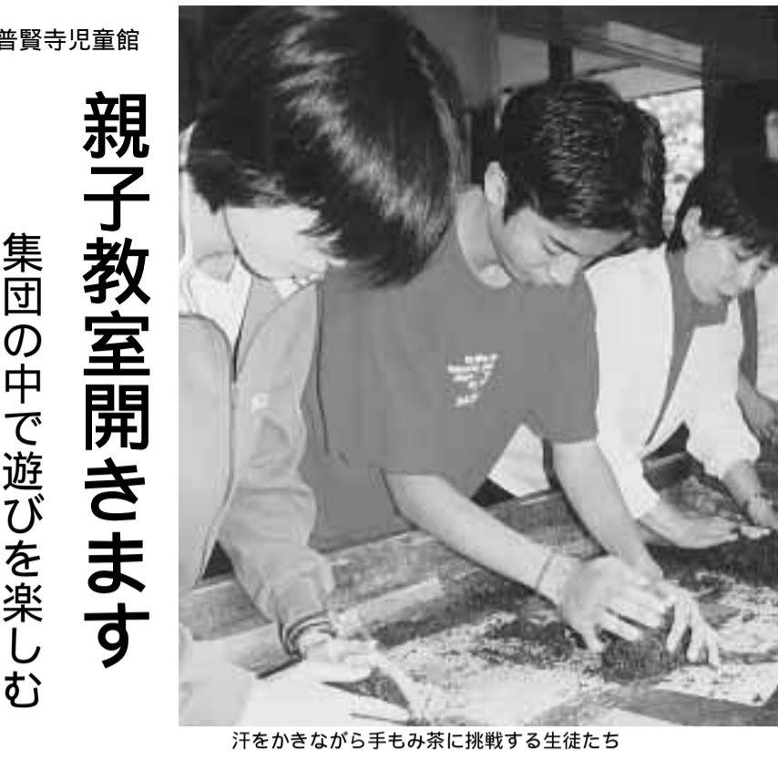
汗をかきながら手もみ茶に挑戦する生徒たち

親子教室開きます 集団の中で遊びを楽しもう 市は親子教室を開き、児童館に送付していただき、開催日「9月4日(火)12月14日(金)の間で年齢別クラスごとに指導する。 時間：各クラスとも 前の部：午前10時～11時 午後の部：午後1時30分～2時30分 場所：普賢寺児童館 内容：左表のとおり 申込方法：往復はがきの往信用に参加希望クラス(実施曜日と午前・午後)の部のいずれかを、参加しようと思った理由・住所・氏名(親子ともふりがな)・あたり、園域の方5千人を親子ともふりがな、無作為に選り、住民意識調査電話番号を、返信用の表に調査票を受け取ったみなさんに書いて普賢寺児童館に送付してください。 南山城地域の10市町で構成され、アンケート用紙に回答していただき、同封の返信用封筒(切手を貼る必要はありません)へお返しいただきます。お申し込みは、無記名で回答していただきます。 しめきり「7月25日(水)」 お問い合わせ先「普賢寺児童館」 〒610-0332 京田辺市水取門6-3 65-0153