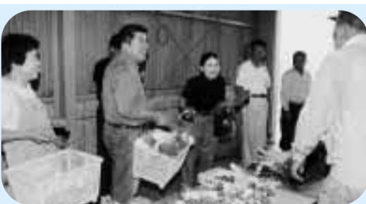
朝市は第2・4日曜日の午前9時～正午

大阪府池田市で発生したうにあらためて協力依頼を市と教育委員会は6月12日に子どもの安全確保を目的にした緊急アピールを発表しました。 また、市と教育委員会は校門に「来訪者は職員室に申し出てください」と書いて看板を設置したり、各クラスに防犯ブザーを配布。は、8月3日(金)から3日間、「児童・生徒の安全をより市内で行われる全国大会へ図ろう」と門扉やフェンスの出場を、6月23日などの点検・修理や緊急事態発生時の教職員体制、児童の登下校時の安全対策を徹底するよう各学校・幼稚園などに指示しました。 また、田辺警察署や防犯推進委員などに子どもたちが安心して学校に通えるよう大会での上位入賞が期待されています。 市小学生ハンドボール大会の6年生男女それぞれの優勝した桃園小学校チームと市男女選抜チームは、8月3日(金)から3日間、桃園小学校など全国ハンドボール大会へ出場します。