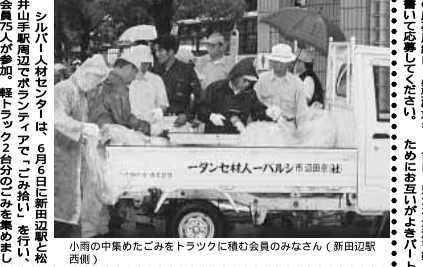
小雨の中集めたごみをトラックに積み会員のみなさん(新田辺駅西側)

シルバー人材センターは、6月6日に新田辺駅と井山手駅周辺でボランティアで「ゴミ拾い」を行い、会員75人が参加、軽トラック2台分のごみを集めました。これは、同センターが今年で設立10周年を迎え、会員からこの節目に「ボランティア活動に取り組んではどうか」との提案があり行われたもの。小雨が降る中、駅前広場などで手拭きみなどを使い、空き缶を回収したり雑草を刈り取るなど、地域のクリーン活動に汗を流しました。同センターは、今後もこのようなボランティア活動を続けていくとしています。