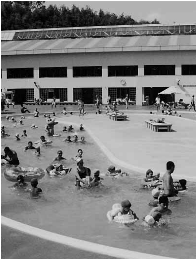
多くの市民でにぎわう田辺公園プール

田辺公園プールは、7月1日(日)から8月31日(金)まで夏期間となります。屋内にあるプールに加え、屋外の流水プールと幼児用プールも利用できます。この夏も、みなさんで誘いあって田辺公園プールにお越しください。 利用時間：午前9時～午後4時30分 夜間の部(午後5時30分～9時30分)は、毎週土・日曜日を除き、屋内でください。 施設：屋内：競泳プール(6コース・25m×13m)、水深1.5～1.35m、水深75cm、幼児用プール(10m×5m、水深75cm)、屋外：流水プール(83m×5m、水深90cm)と幼児用プール(8m×8m、水深40cm)以下の人には、必ず保護者と一緒にご利用ください。 入場料：大人(高校生以上)：300円、小人(小学生以下)：100円、外：流水プール(83m×5m)へお問い合わせてください。