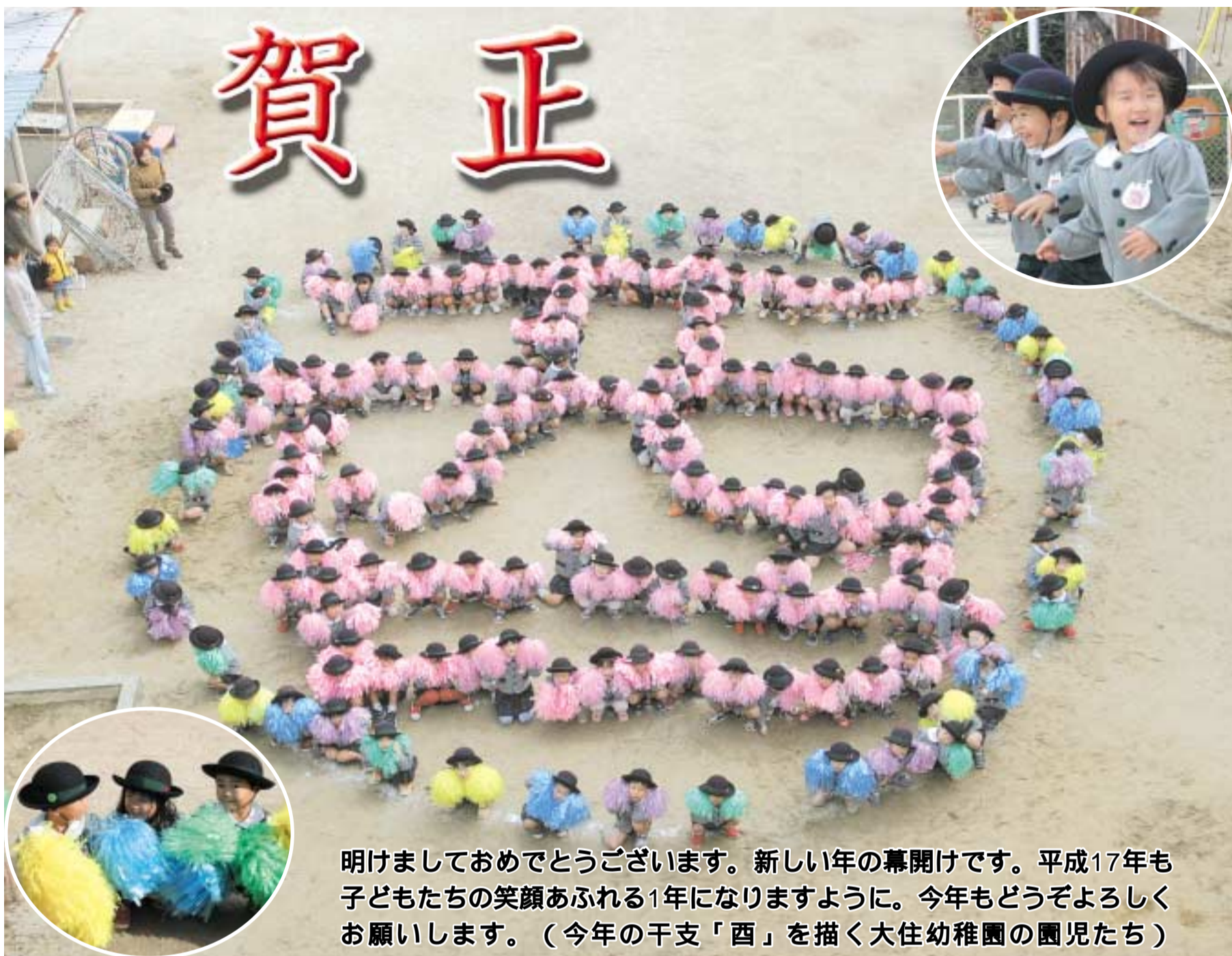
明けましておめでとうございます。新しい年の幕開けです。平成17年も子どもたちの笑顔あふれる1年になりますように。今年もどうぞよろしくお祈りします。(今年の干支「酉」を描く大住幼稚園の園児たち)