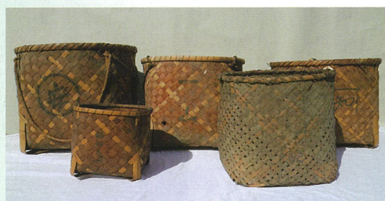
茶摘み籠とシンド