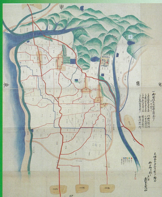
山城国綴喜郡大住村絵図(天保14年)